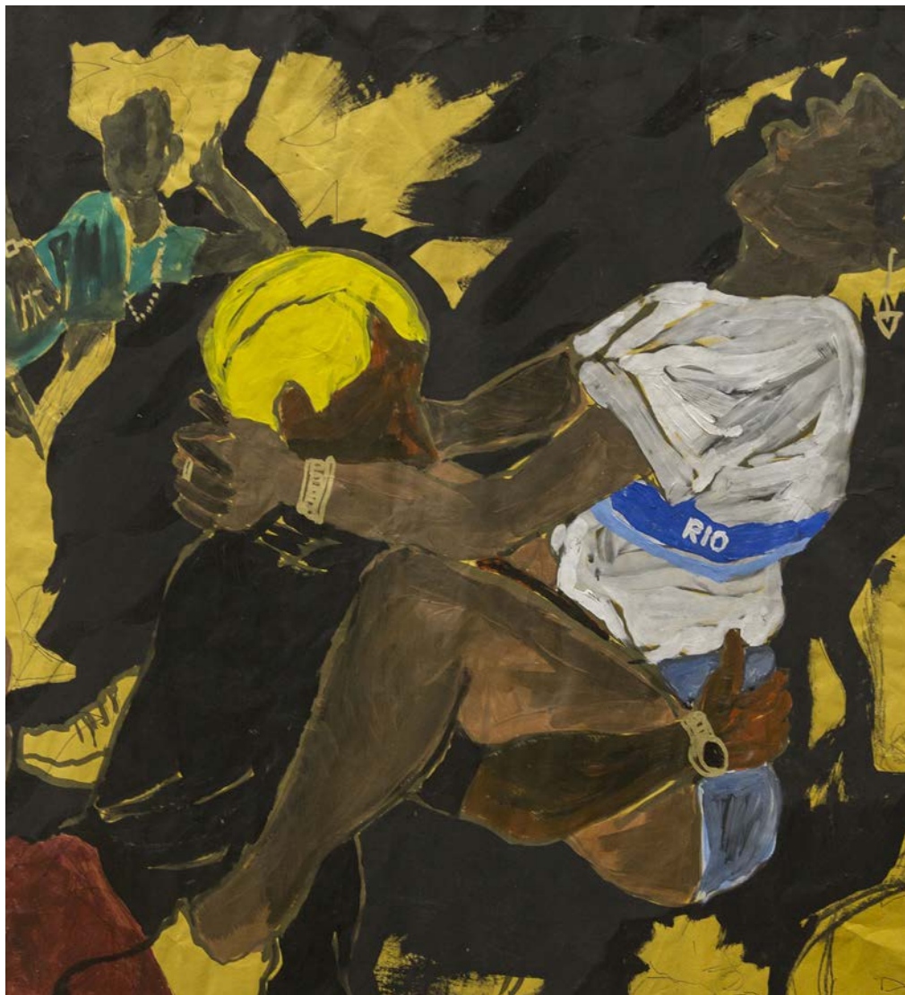
Maxwell Alexandre Série "Pardo é Papel", A lua quer ser preta, se pinta no eclipse (détail), 2018 Collection particulière, Majorque