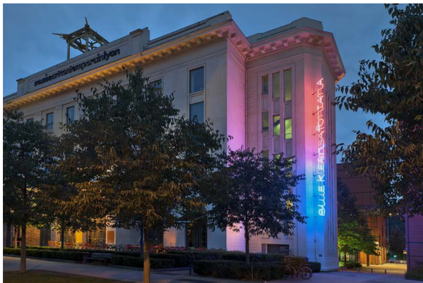
Vue du Musée d'art contemporain de Lyon

→ En vélo De nombreuses stations vélo'v à proximité du musée Piste cyclable des berges du Rhône menant au musée