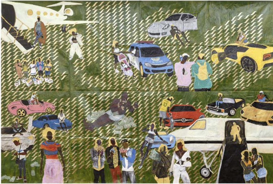
Maxwell Alexandre Série "Pardo é Papel" Só quando tu tá com as folhas geral gosta de salada , 2018 Collection Frances Reynolds et détail ci-dessous