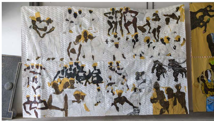
Maxwell Alexandre Série "Pardo é Papel" Meus manos, minhas minas, meus irmãos, minhas irmãs e meus cães, 2018 et détail ci-contre