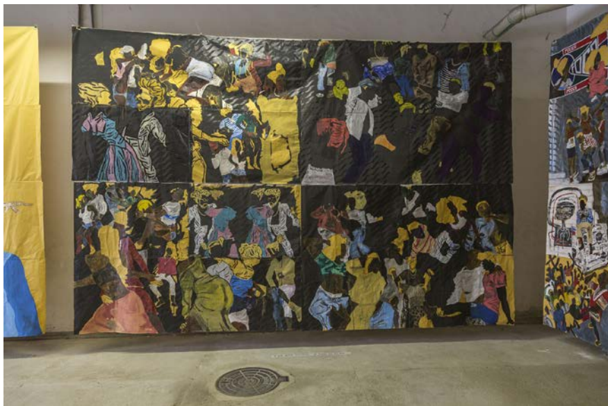
Maxwell Alexandre Série "Pardo é Papel" A lua quer ser preta, se pinta ne eclipse, 2018 et détail ci-contre Collection particulière, Majorque