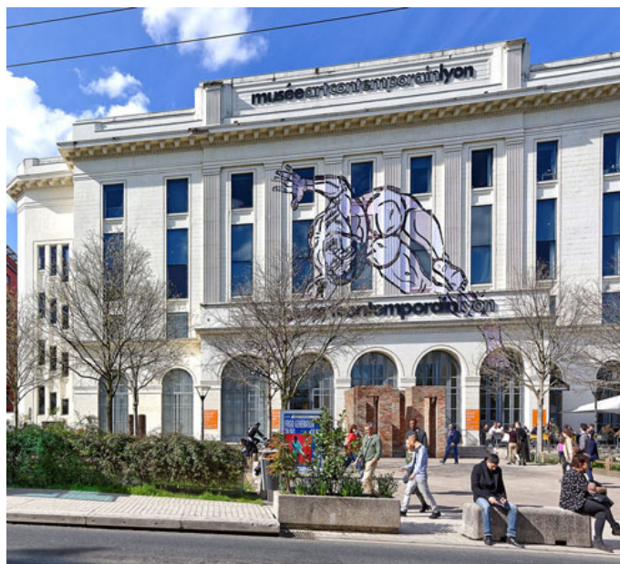
Vue du Musée d'art contemporain de Lyon

Le mac LYON privilégie l'actualité artistique nationale et internationale, sous toutes ses formes, avec des expositions mais aussi un large programme d'évènements transdisciplinaires. Compte tenu de son ampleur, sa collection, constituée dès 1984, compte plus de 1400 œuvres. Elle est montrée partiellement et par roulement au mac LYON mais aussi au musée des Beaux-Arts (MBA) et dans de nombreuses structures partenaires. Elle est constituée en grande partie d'œuvres monumentales ou d'ensembles d'œuvres, des années 40 à nos jours, créées par des artistes de tous les continents, pour la plupart à l'occasion d'expositions au musée ou encore lors des Biennales d'art contemporain de Lyon dont le musée assure la direction artistique. Réunies dans un Pôle art, avec le MBA en 2018, les 2 collections forment un ensemble exceptionnel en France et en Europe.