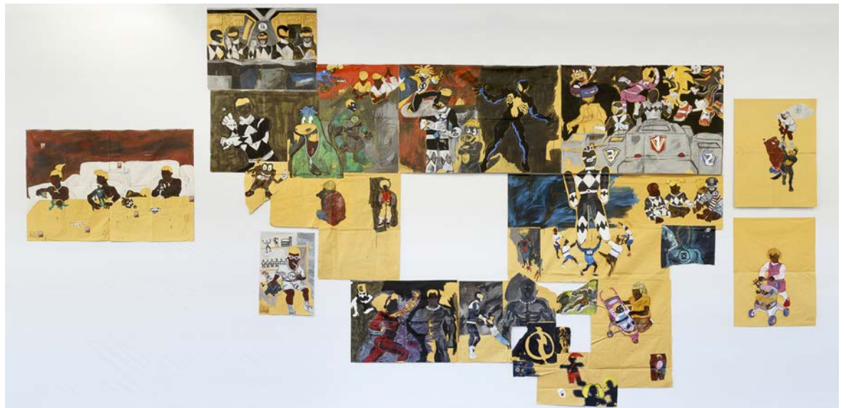
Maxwell Alexandre, série "Pardo é Papel", Megazord só de Power Ranger Preto , 2018 Courtesy Fortes D'Aloia & Gabriel et A Gentil Carioca et détails ci-dessous