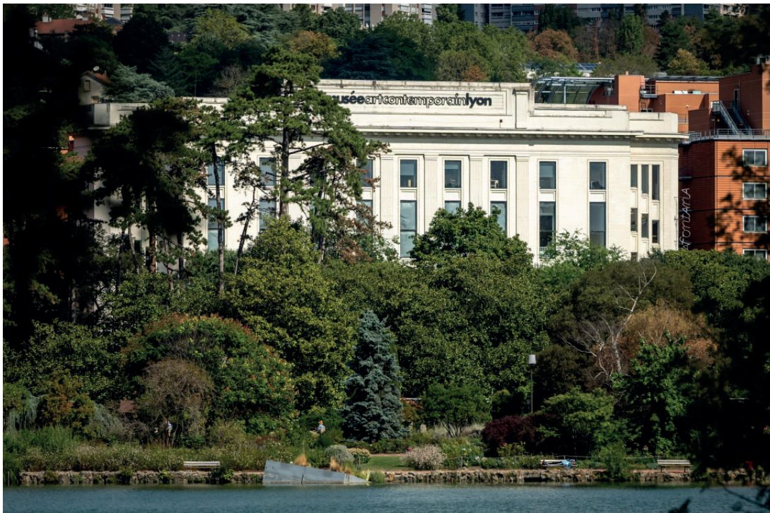
Vue du Musée d'art contemporain de Lyon

Réunies dans un pôle des musées d'art avec le Musée des Beaux-Arts de Lyon en 2018, les deux collections forment un ensemble exceptionnel en France et en Europe, avec des pièces de l'Antiquité à nos jours.