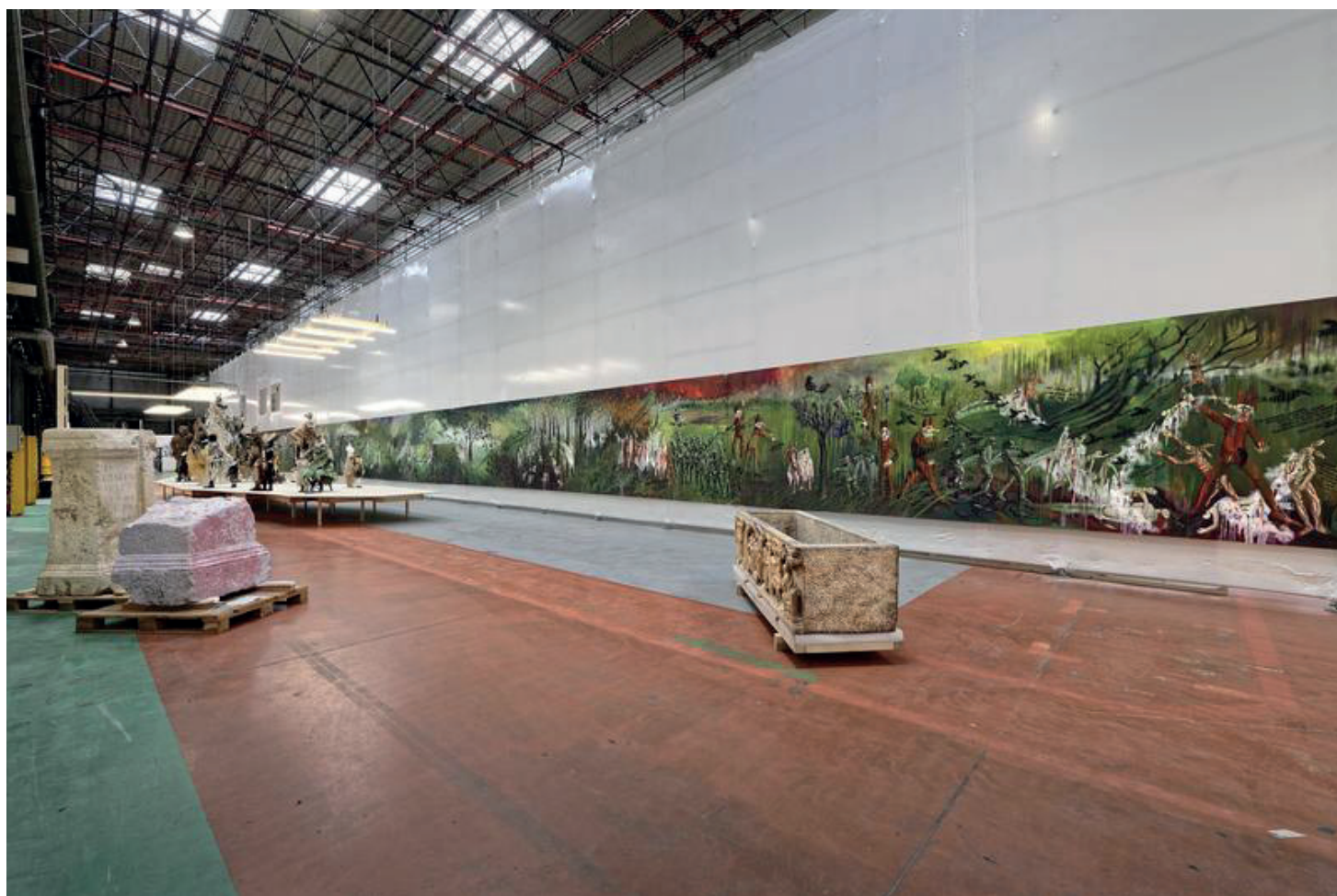
Sylvie Selig, Stateless , huile sur toile de 50 mètres de long ; Weird Family , 28 sculptures ; série de dessins et broderies sur tissus. 16 e Biennale d'art contemporain de Lyon, Usines Fagor, 2022. Courtesy de l'artiste Avec le soutien de Art Services Transport Photo Blaise Adilon

« Financez un film qui vous ressemble » clamait-il !