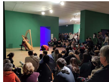
What'Sup, festival du CNSMD au macLYON, 2023

+ pour punctuer la journée : interventions sonores et musicales proposées par les étudiant-es du CNSMD Lyon (Conservatoire national supérieur de musique et de danse de Lyon)