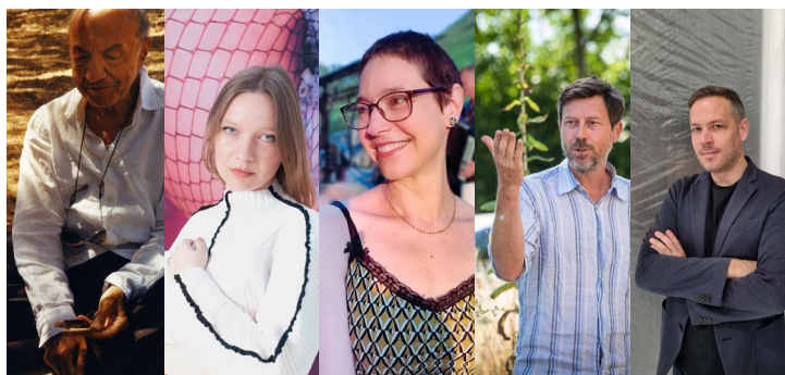
Sarkis © Thierry Lefébure – Marilou Poncin © Marilou Poncin – Nadia Kaabi-Linke © Timo Kaabi-Linke – Jan Kopp - Droits réservés – Matthieu Lelièvre - Droits réservés

Témoignages d'artistes sur la collaboration entre artistes et musée avec Sarkis, Marilou Poncin, Nadia Kaabi-Linke et Jan Kopp. Modération : Matthieu Lelièvre, responsable des collections du macLYON.