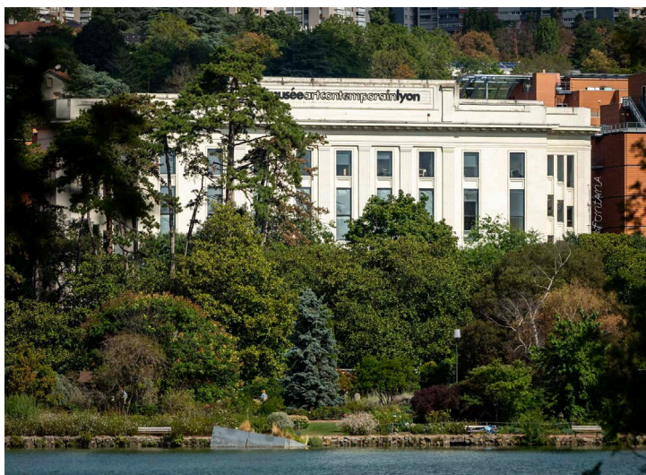
Vue du musée