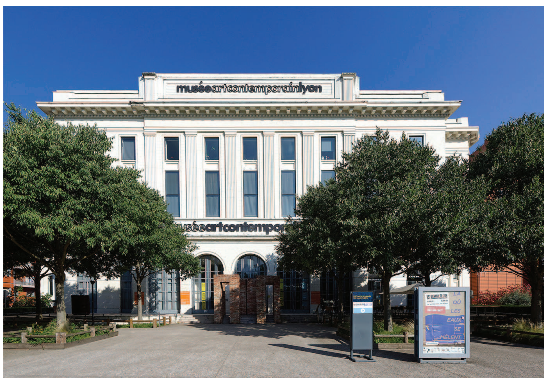
Vue du Musée d'art contemporain de Lyon.

Réunies dans un pôle art avec le Musée des Beaux-Arts de Lyon en 2018, les deux collections forment un ensemble exceptionnel en France et en Europe.