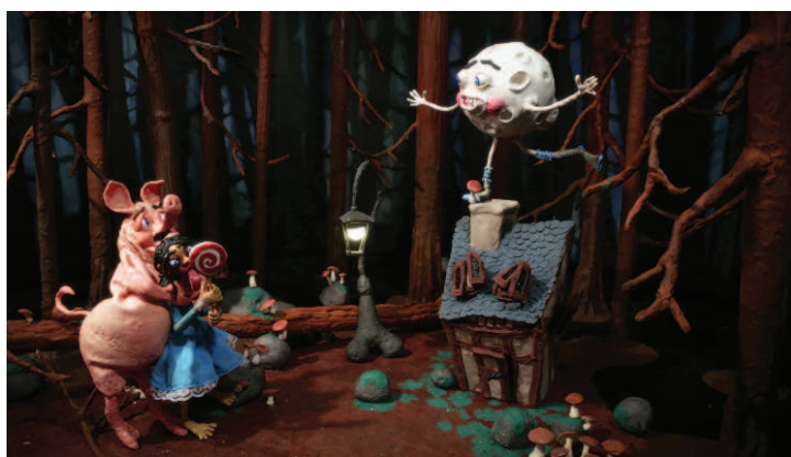
Nathalie Djurberg & Hans Berg, Dark Side of the Moon , 2017 Animation en stop motion, musique – Durée : 6'40"

Nathalie Djurberg modèle ses figurines à l'argile et à la plasticine, les habille de tissus et perruques et les anime en stop motion. Hans Berg, musicien et compositeur, signe une bande son hypnotique qui donne vie et intensité à chacun de leurs films. Ensemble, ils créent des œuvres allégoriques et grotesques, chaotiques et euphoriques, burlesques et critiques, mettant en scène des personnages aux corps exagérés, parfois torturés, en lutte ou en osmose avec d'autres créatures, souvent animales ou inspirées de contes. Leurs œuvres fantaisistes aux récits transgressifs sont présentées dans des environnements immersifs, où images en mouvement, sculptures et compositions musicales se mêlent à d'étonnants décors.