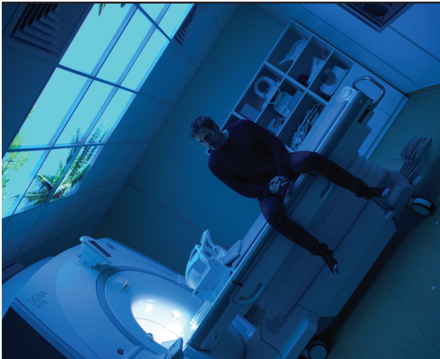
Jesper Just, photographie de tournage, 2023

Le film INTERFEARS est produit par Anna Lena Films Coproduit par macLYON, Perrotin, Galleri Nicolai Wallner Avec le soutien de The Danish Arts Council Avec la participation du DICRÉAM