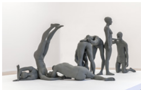
Vue de l'exposition Daniel Firman, La matière grise au mac LYON , 2013

Sur demande, nous accompagnons les partenaires éducatifs dans l'élaboration d'outils pédagogiques en lien avec nos expositions.