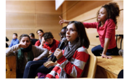
Forum des enfants citoyens au mac LYON , 2012