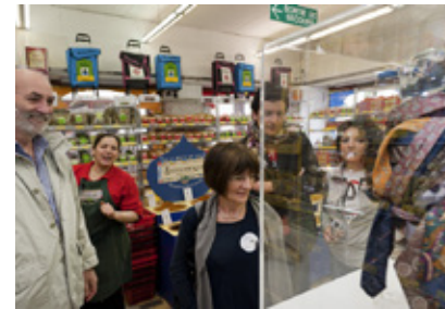
Exposition P.M. Tayou, visite hors les murs mac LYON , 2011