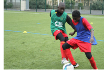
Projet L'art occupe le terrain , dans le cadre du stage « Tempo », AS Duchère, 2012