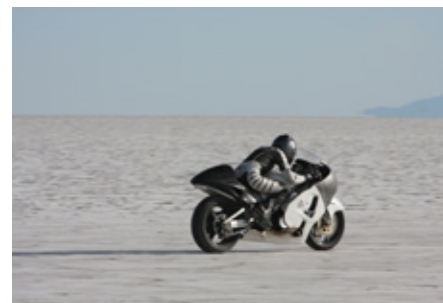
Janet Biggs, Vanishing Point , 2009 Vidéo 10'32"

Plus de 200 œuvres explorent les relations entre art et moto. → Du 21 février au 20 avril 2014