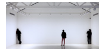
Oliver Beer, Composition for Hearing an Architectural Space , 2013

Dialogue entre le corps, la voix et l'architecture. → Du 6 juin au 17 août 2014