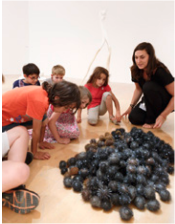
Visite de l'exposition Philippe Droguet, Blow up au mac LYON , 2013