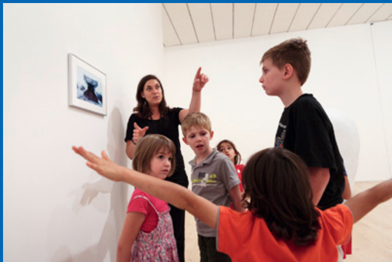
Visite de l'exposition Daniel Firman Exposition La matière grise au mac LYON , 2013

Collaborer, coopérer, élaborer ensemble des projets... À tout moment de nos propositions, nous engageons avec les publics des relations d'échange et de partenariat. Ce document s'adresse aux coordinateurs de groupes enfants, jeunes, adultes: il vous accompagne dans l'organisation des activités autour des expositions et vous suggère d'en inventer avec nous.