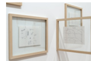
Morton Feldman, XXX, Anecdotes and Drawings , 1984 Collection mac LYON

Dans le cadre de la Biennale Musiques en scène 2014. Morton Feldman, Heiner Goebbels, Ulf Langheinrich: les œuvres des trois artistes musiciens invitent à une «écoute profonde». → Du 6 mars au 20 avril 2014