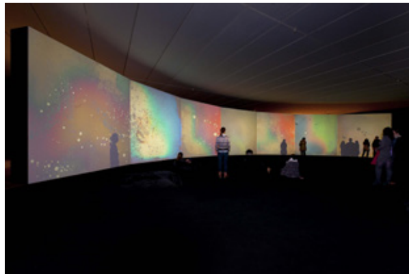
Gustav Metzger, Supportive , 2011 Vue de l'exposition au mac LYON , 2013 © Collection mac LYON