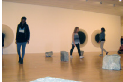
Lycéens en atelier dans l'exposition Latifa Echakhch, Laps au mac LYON , 2013