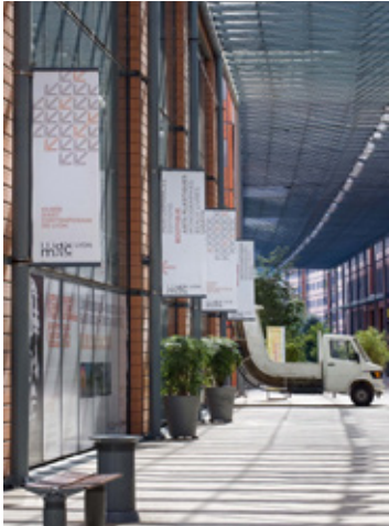
Façade du musée côté rue couverte