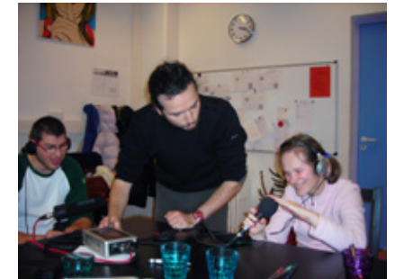
Projet L'art sur écoute , Institut pour jeunes aveugles Les Primevères, 2012