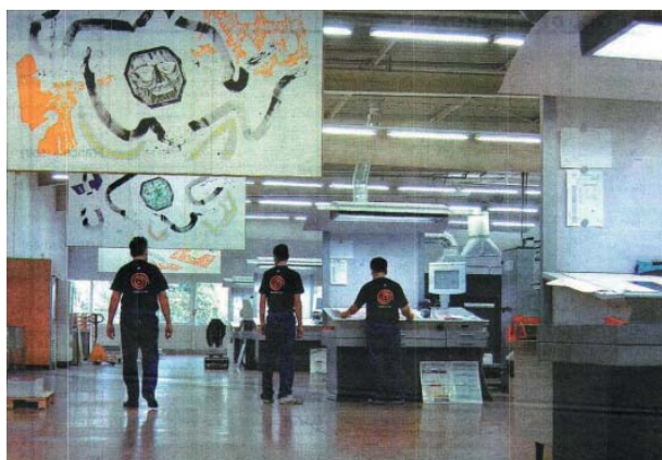
Vue de l'exposition « hors les murs » Factory on Time chez Fot Imprimeurs, 2005

L'ENGAGEMENT POUR L'ACCÈS DE TOUS LES PUBLICS À LA CULTURE EST UNE PRIORITÉ POUR LE MAC LYON