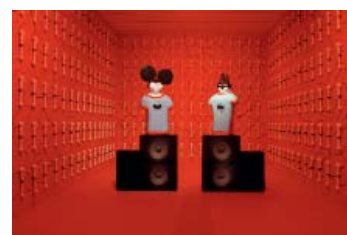
Vue de l'exposition Fabien Verschaere, Seven days hotel , 2007 © Blaise Adillon © Adagp, Paris 2010