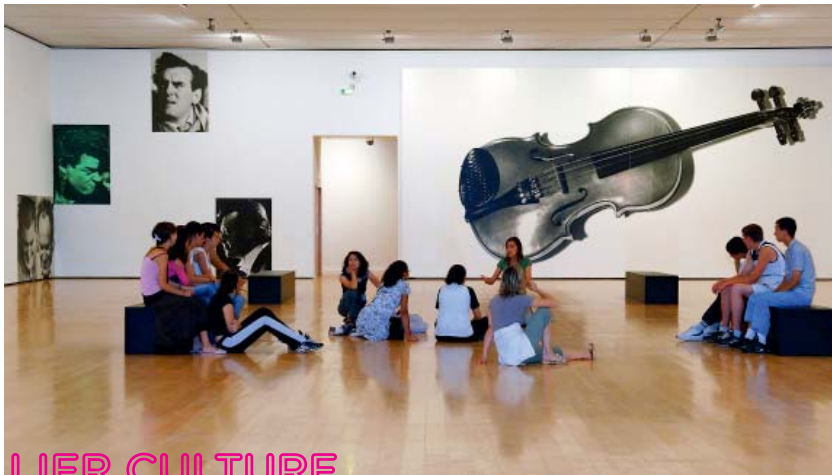
John Baldessari, Composition for Violin and Voices (Males) , 1987. Collection du mac LYON