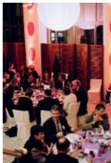
Soirée privée à l'occasion de l'exposition Andy Warhol

Le mac LYON vous offre son hall de réception pour vos événements, ils peuvent être accompagnés de la découverte des expositions en cours. Les visites se font librement ou avec un médiateur, suivant votre choix. Terminez la soirée par un dîner assis (75 personnes maximum) ou un cocktail (280 personnes).