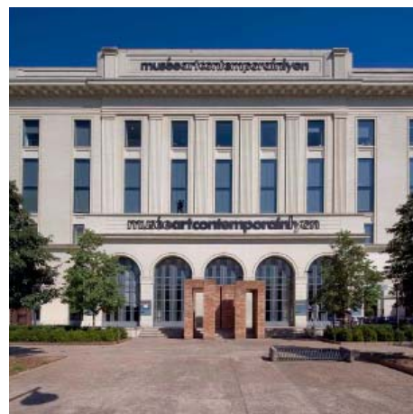
Vue extérieure du mac LYON