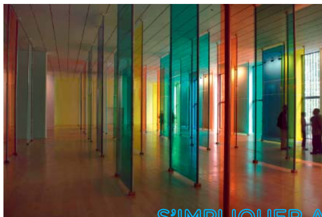
Daniel Buren, Le temps d'une œuvre , collection du mac LYON , 2005 © Blaise Adilon © Adagp, Paris 2010