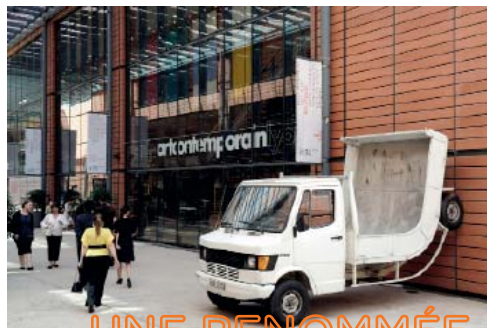
Vue extérieure du mac LYON , 2008

UNE RENOMMÉE NATIONALE ET INTERNATIONALE ÉTABLIE GRÂCE À LA QUALITÉ DE SA PROGRAMMATION ET À SES COLLABORATIONS AVEC UN LARGE RÉSEAU D'INSTITUTIONS DANS LE MONDE.