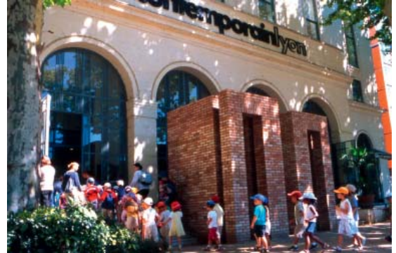
Visite scolaire au mac LYON

Votre contribution peut intervenir sous la forme de financement ou de mécénat de compétences,