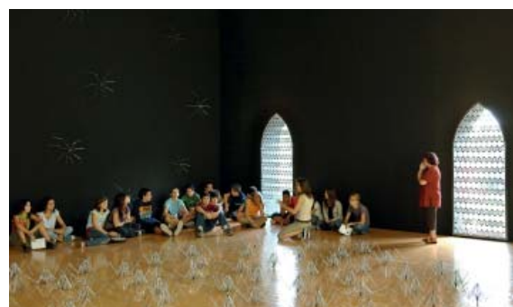
Vue de l'exposition Kader Attia, 2006 au mac LYON © Blaise Adilon. © ADAGP, Paris, 2010