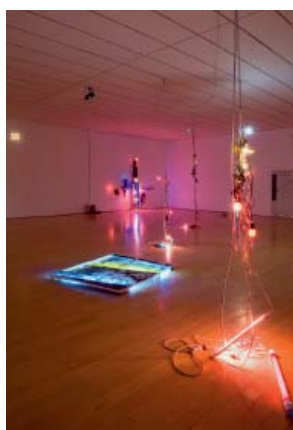
Vue de l'exposition Alan Vega au mac LYON , 2009