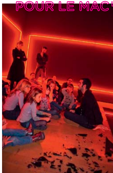
Vue de l'exposition Lori Hersberger, 2008