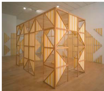
Daniel Buren, La Cabane éclatée n°8 , 1985. Collection du mac LYON © Blaise Adillon © Adagp, Paris 2010