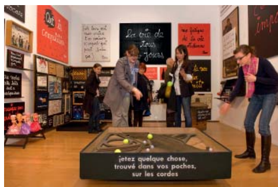
Vue de l'exposition Strip-tease intégral de Ben au mac LYON © ADAGP, Paris, 2010

DES RECORDS DE FRÉQUENTATION POUR UN MUSÉE D'ART CONTEMPORAIN DE PROVINCE