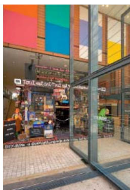
Vue du mac LYON côté rue intérieure 2008

UNE RENOMMÉE NATIONALE ET INTERNATIONALE ÉTABLIE GRÂCE À LA QUALITÉ DE SA PROGRAMMATION ET À SES COLLABORATIONS AVEC UN LARGE RÉSEAU D'INSTITUTIONS DANS LE MONDE.