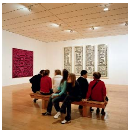
Vue de l'exposition Keith Haring au mac LYON , 2008

Lu dans la presse à l'occasion de la rétrospective Keith Haring: