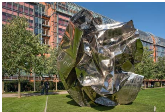
Wang Du, World Markets , 2004 Œuvre entrée dans la Collection du mac LYON grâce au don de la société TAIR Kameleone avec le soutien de l'artiste, de Gilles Blanckaert, de Jean-Pierre Michaux et de la galerie Laurent Godin © Adagp, Paris, 2010

En s'associant à l'acquisition d'une œuvre d'art qui viendra rejoindre la collection du musée, votre entreprise s'unit à l'innovation et à la créativité, tout en bénéficiant d'avantages fiscaux. Constituée à la fois de l'actualité la plus récente de l'art contemporain et de productions inédites créées spécifiquement par les artistes, la collection du mac LYON est unique et riche en œuvres réalisées à l'occasion de ses expositions.