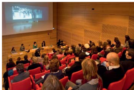
Salle de conférence (colloque Robert Morris), 2008

Les expositions du mac LYON s'accompagnent d'un programme de conférences et interventions d'artistes, commissaires d'exposition, historiens d'art, réalisateurs de films et vidéos... qui permettent le dialogue, le partage, le croisement des disciplines et des regards. Elles ont lieu au musée, mais également hors les murs : à l'université, en entreprise, au cœur de l'espace public (comme la fresque en gare de Perrache réalisée pour l'exposition Keith Haring ou le flasmob Ben)... afin d'aller à la rencontre de chacun. Votre soutien permet d'enrichir et de multiplier ces propositions culturelles, qui peuvent inclure le concours actif de vos employés, pour un musée ouvert sur son environnement.