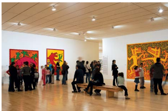
Vue de l'exposition Keith Haring au mac LYON , 2008

Les grandes expositions du mac LYON ont connu un succès sans précédent: plus de 100 000 visiteurs pour le Strip-Tease intégral de Ben en 2010, 168 000 visiteurs en 2008 pour la rétrospective Keith Haring et 147 000 en 2005 pour l' Œuvre Ultime d'Andy Warhol.