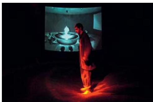
Vue de l'exposition Mathieu Briand au mac LYON , 2004, collection du musée – signatures