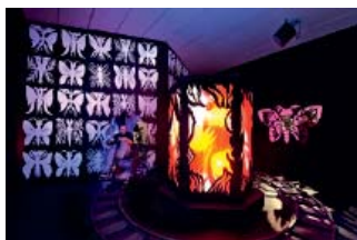
Vue de l'exposition Quintet au mac LYON , Salle de Stéphane Blanquet, 2009

L'art contemporain interroge la société, la reflète et prend des risques, il nous place dans des espaces sensoriels intenses et les formes qu'il utilise sont aussi diverses que surprenantes. Il explore le monde actuel pour aller vers de nouvelles voies : comme l'entreprise, l'art contemporain est au cœur de la société; il est un engagement sur l'avenir.