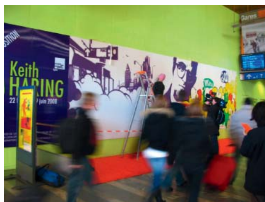
Fresque en gare de Perrache dans le cadre de l'exposition Keith Haring au mac LYON , 2008