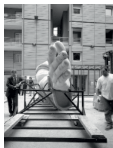
Arrivée de l'oeuvre de Sui Jianguo

Échangez vos espaces publicitaires contre la visibilité de votre logo sur nos supports de communication.