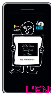
Application iPhone Ben

En soutenant le musée dans ces initiatives, sous la forme d'un mécénat de compétences ou technologique, vous participez à sa volonté d'être un musée moderne et accessible à tous, et vous inscrivez votre entreprise dans l'avenir.