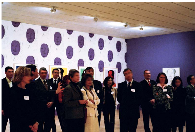
Visite en nocturne à l'occasion de l'exposition Andy Warhol

Située au rez-de-chaussée du Musée, la salle de conférences offre jusqu'à 72 places assises et est équipée d'un dispositif son/vidéo adapté à tout support. Cet espace pourra accueillir assemblées générales, conférences de presse ou présentations.