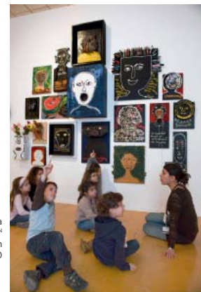
Visite/Atelier enfants pour la Rétrospective Ben au mac LYON © Blaise Adilon © Adagp, Paris, 2010