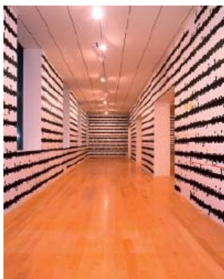
Joseph Kosuth, Zéro et non , 1985, collection du mac LYON © Adagp, Paris 2009

› Le système retenu permet de transformer intégralement les espaces intérieurs et de varier les éclairages : naturel, artificiel ou zénithal (au 3 e étage). Ce principe donne la possibilité de présenter un musée entièrement nouveau à chaque exposition. Que ce soit pour une rivière de l'artiste Cai Guo-Qiang, un « mur qui pleure » d'Ann Hamilton ou encore un trampoline géant de Mathieu Briand, le musée est reconfiguré pour chaque projet artistique.