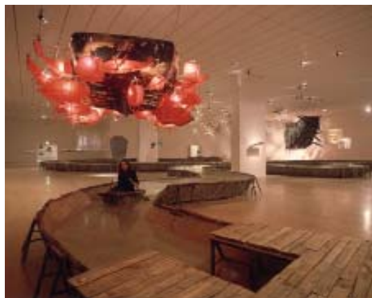
Vue de l'exposition Cai Guo Qiang au mac LYON, 2001

› Pour la plupart monumentales, les œuvres de la collection sont signées John Baldessari, Ben, Daniel Buren, Sophie Calle, Dan Flavin, Lucio Fontana, Gilbert & George, Anish Kapoor, Joseph Kosuth, Sol LeWitt, Jean-Pierre Raynaud, Edward Ruscha, Bill Viola... 268 artistes et 1053 œuvres rassemblés dans un catalogue raisonné édité en 2009.