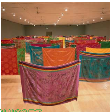
Kim sooja, A laundry woman , 2000–2003, Collection du mac LYON

ENRICHISSEZ LE PATRIMOINE CULTUREL CONTEMPORAIN PAR VOTRE SOUTIEN À L'ACQUISITION D'UNE ŒUVRE D'ART