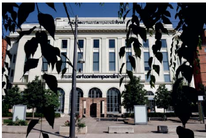
Vue du mac LYON côté parc de la Tête d'or 2008

› Le mac LYON s'installe en 1995 dans un nouvel édifice conçu par Renzo Piano à la Cité Internationale. Il est inauguré avec la 3 e Biennale d'art contemporain de Lyon.