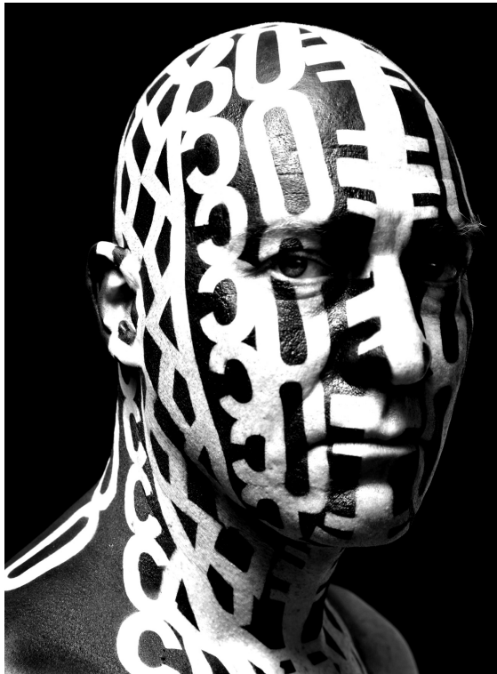
Fuckface , 2007, Photographie © Lydie Nesvadba