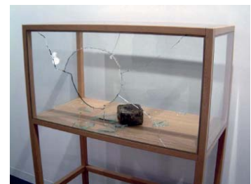
6— Kendell Geers, T.W. (Vitrine), 1993 Vitrine en bois et verre Dimensions: 165 x 110 x 56cm Courtesy Kendell Geers et Stephen Friedman Gallery, London