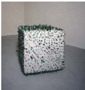
5— Mondo Kane, 2002 Tessons de verre, béton