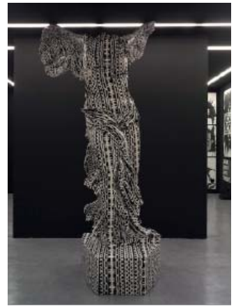
3— Cadavre Exquis, 2007 Reproduction grandeur nature en résine de la Victoire de Samothrace, repeinte au motif Fuck