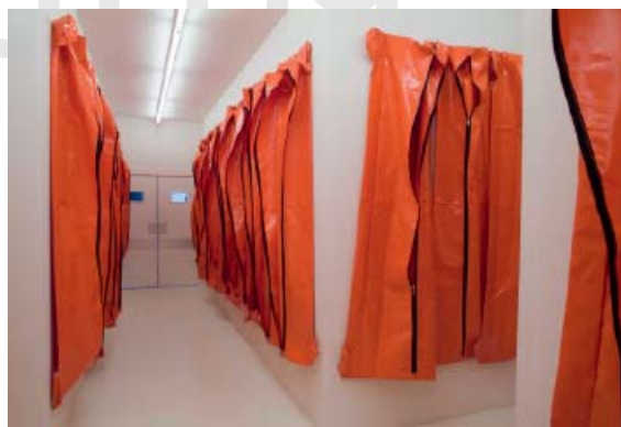
4— Song of the Pig, 2000 Sacs mortuaires, techniques mixtes © Kendell Geers and Dirk Pauwels (photographe) Courtesy Collection Dimitris Daskalopoulos, Grèce