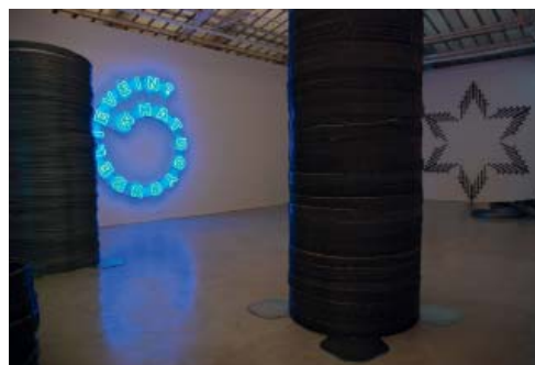
7— Vues d'installation de l'exposition Kannibale à la galerie Yvon Lambert, Paris (18 octobre - 8 décembre 2007) Oeuvres : Manifest & H.E.X.