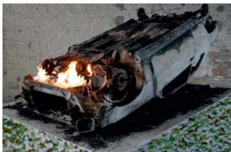
8— Kendell Geers, Monument to the Unknown Anarchist, 2007 Voiture, feu, gaz, béton, verre Dimensions: 170 x 247 x 376 cm