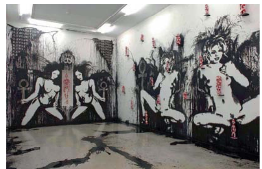
9— On the Declamation and Preeminence of the Female Sex, 2005 Vue d'installation pour la Biennale de Lyon 2005