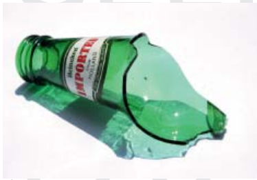
1— Selfportrait, 1995 Bouteille de bière