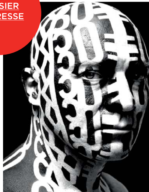
Fuckface, 2007 Photographie © Lydie Nesvadba