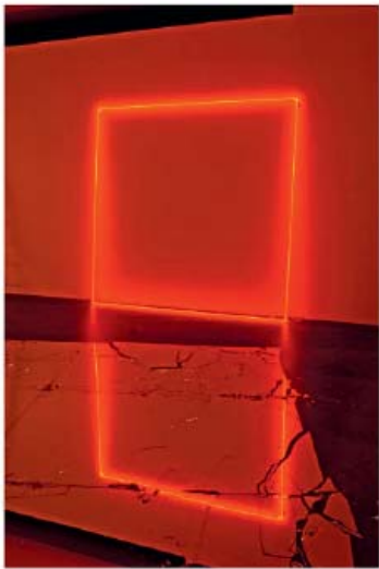
3— Lori Hersberger, Ghost Rider , 2004 Installation, détail Néon, miroirs brisés Collection Alexander Bürkle, Freiburg i.Breisgau