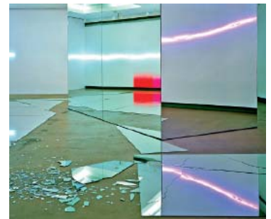
7— Lori Hersberger, Spin My Wheel , 2003 Néons, miroirs, peinture murale Vue de l'exposition Kunsthau Zürich (2006)