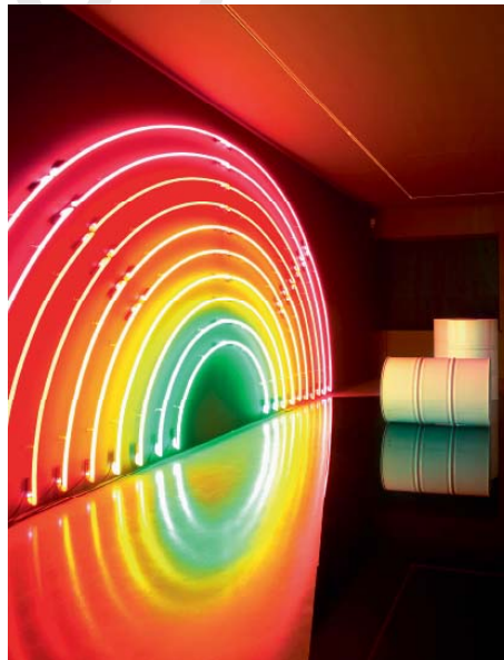
4, 5— Lori Hersberger, Zombie Voyager Nr. 1 , 2007 Néons, barrils en métal blanc, verre noir Neon H.140 cm x W.290 cm x D.160 cm Vue de l'exposition Annex Galerie Thaddaeus Ropac, Salzburg (2007)