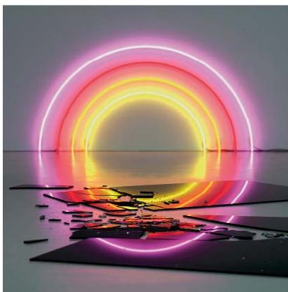
6— Lori Herberger, Sunset 184 , 2006 Néon H.90 cm x W.184 cm, miroirs brisés Vue de l'exposition Insideout , Galerie Mehdi Chouakri Berlin (2006)