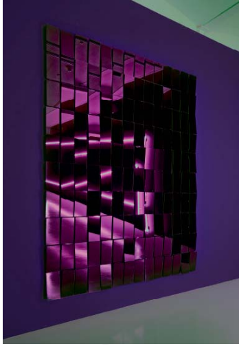
1— Lori Hersberger, Phantom Studies , 2008 Verre noir, relief, 250 cm x 150 cm Vue de l'exposition Phantom Studies , Galerie Mehdi Chouakri, Berlin (2008)