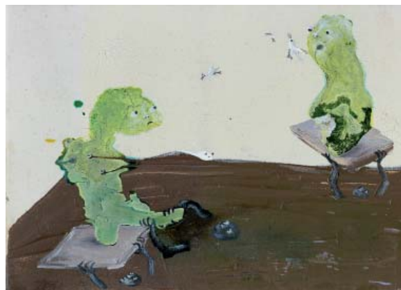
Marlène Mocquet, La peinture sable mouvant , 2008 Techniques mixtes sur toile 16 x 22 cm Collection particulière

Ce qui caractérise ses tableaux, c'est l'étrangeté du phénomène d'apparition propre au médium. De la flaque naît le monstre qui dévore la poupée à robe rouge, saisie en quelques traits de pinceau. Une trainée de matière pâteuse laisse surgir par l'adjonction de quelques points noirs, des visages hurleurs pris de vitesse. Les personnages se jouent de l'espace et des dimensions, parfois gigantesques face à des lilliputiens, parfois minuscules dans un paysage infini. Sans qu'il soit véritablement possible d'en déterminer l'instant, la figure apparaît, l'histoire dramatique, naïve, hirsute ou «rigolote» s'articule dans l'enchaînement des traces picturales, des adjonctions et des superpositions de couches. Marlène Mocquet se laisse surprendre par les différents états de sa peinture qu'elle maîtrise pourtant au plus près de sa forme, c'est ainsi qu'elle nous étonne et nous émerveille.