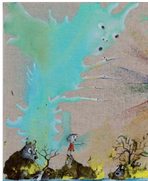
Marlène Mocquet, L'arbre effeuillé à la pomme , 2008 Techniques mixtes sur toile 26,5 x 22 cm Courtesy Galerie Alain Gutharc - Copyright Marc Damage Collection particulière