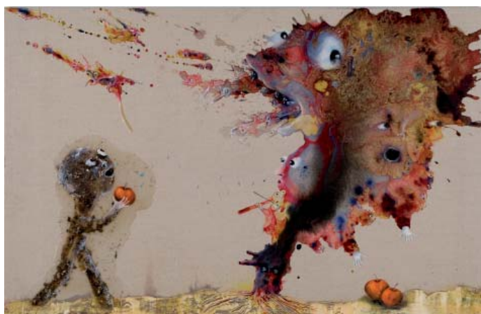
Marlène Mocquet, L'homme poussière à la pomme , 2008 Techniques mixtes sur toile 130 x 200 cm Collection particulière