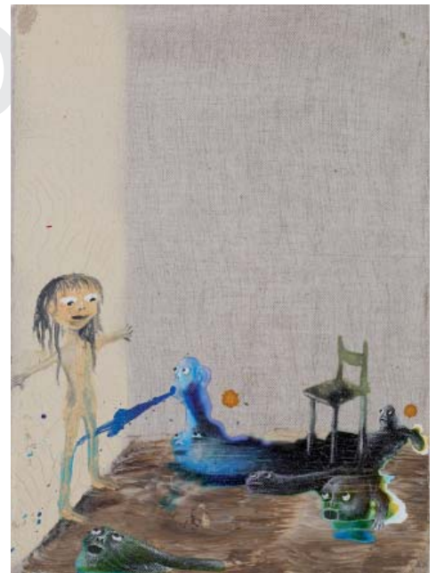
Marlène Mocquet, Attaquée par la peinture , 2007