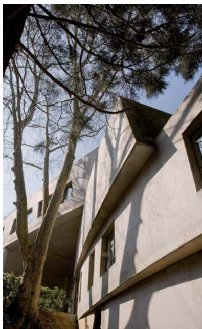
Georges Adilon, Saint-Paul

Pendant toute la durée de l'hommage, le Lycée Sainte-Marie Lyon ouvre ses portes pour des visites accompagnées dans les différents sites qui le composent :