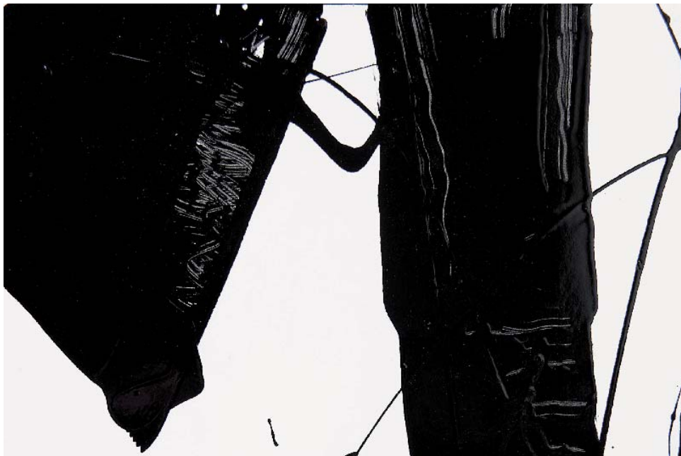
Georges Adilon, Sans titre , peinture, détail, 1995 © Blaise Adilon