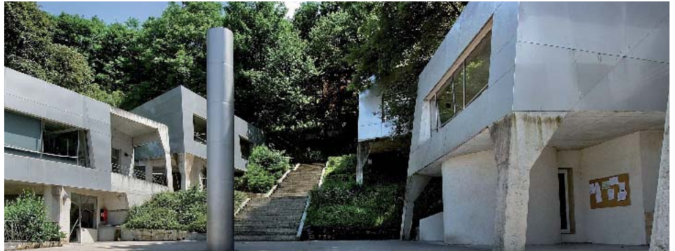
Georges Adilon, La Solitude , Lyon

Adilon dit qu'il n'a pas d'imagination. Il a au moins des idées. Ses projets jaillissent d'une idée en apparence très simple exposée sur un croquis élémentaire ; la complexité du bâtiment est cependant en gestation dans cette idée qui lui confère sa cohérence son unité. Il suffit d'avoir cette idée. Ses constructions seront donc simples en un sens parce qu'homogènes, sans ajouts ni discontinuités, mais aussi complexes parce qu'incorporant de nombreuses contraintes ; complexes et non compliquées, parce que la simplicité de l'idée initiale est toujours présente. La richesse de l'ensemble vient de cette coexistence du simple et du complexe ; elle ne se découvre que lentement. On est toujours étonné, surpris par un détail jusqu'alors inaperçu. Architecture vivante qui ne se donne pas au premier coup d'œil mais qui porte le rêve d'un monde libéré.