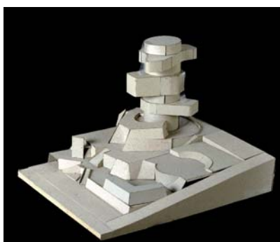
Georges Adilon, maquette

Inauguration : samedi 16 octobre 2010 de 16h à 20h