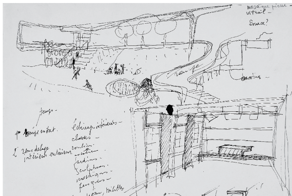
Georges Adilon, recherches

21, rue André Bonin 69004 Lyon, 09 51 01 57 58, www.galeriedesprojets.net