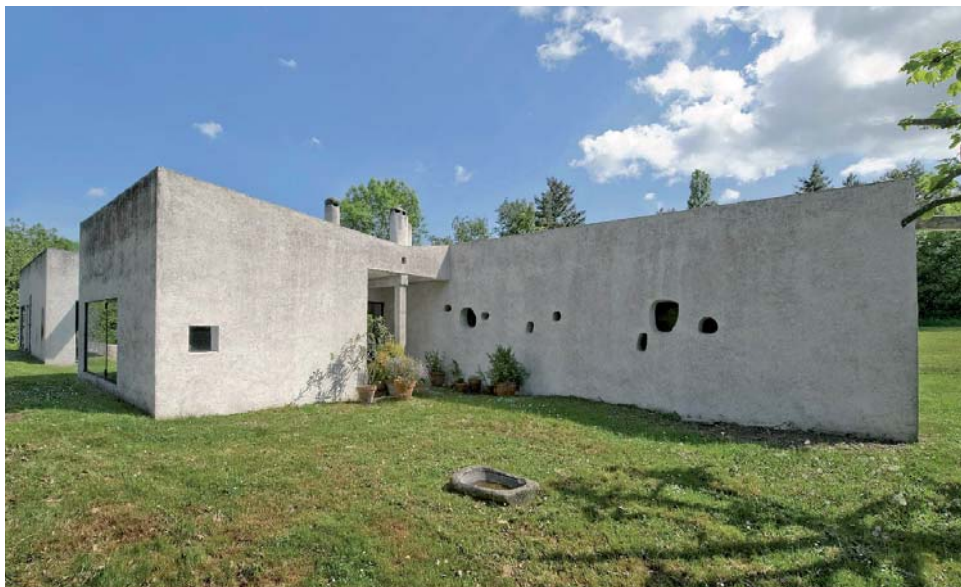
Georges Adilon, maison © Blaise Adilon

6 bis, quai Saint-Vincent 69001 Lyon, 04 72 07 44 55, www.caue69.fr