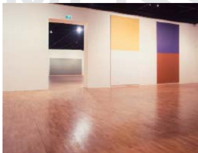
Vue de l'exposition Olivier Mosset , mac LYON Saint Pierre Art Contemporain, Lyon, 1987