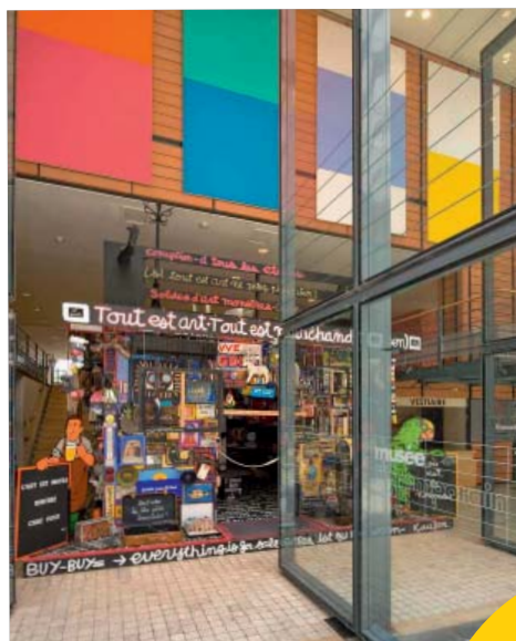
Vue du hall du macLYON