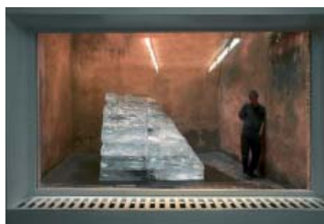
Toberone, 2005 Polyèdre de glace à 8 faces 180 x 220 x 180 cm Vue de l'exposition à La Salle de bains, 2006 Collection du mac LYON

mac LYON Saint Pierre Art Contemporain, Lyon Collection du mac LYON