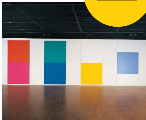
De gauche à droite : Escort , 1987 - Acrylique sur toile - 426 x 213 cm Estate , 1987 - Acrylique sur toile - 426 x 213 cm Skylark , 1987 - Acrylique sur toile - 426 x 213 cm Carré bleu sur fond blanc , 1987 - Acrylique sur toile - 426 x 213 cm Collection du mac LYON