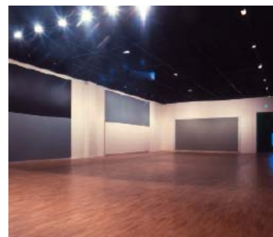
Vue de l'exposition Olivier Mosset , mac LYON Saint Pierre Art Contemporain, Lyon, 1987