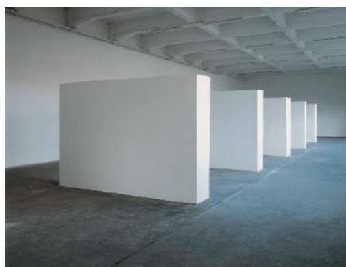
Cimaise - sculpture en cinq éléments, 1993 Cinq éléments en bois peint 302 x 50 x 200 cm, 200m 2 vue de l'exposition L'Usine / Le Consortium, Dijon, 1993 Collection du mac LYON