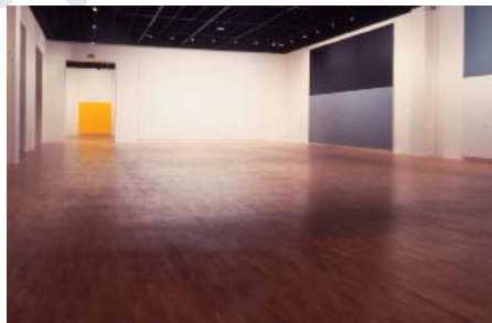
Vue de l'exposition Olivier Mosset , mac LYON Saint Pierre Art Contemporain, Lyon, 1987