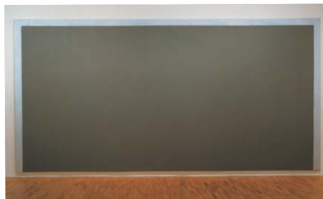
A Step Backwards, 1986 Huile et peinture cellulosique sur toile - 300 x 600 cm mac LYON Saint Pierre Art Contemporain, Lyon Collection du mac LYON