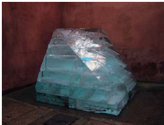
Toberone, 2005 Polyèdre de glace à 8 faces 180 x 220 x 180 cm Vue de l'exposition à La Salle de bains, 2006 Collection du mac LYON © Olivier Vadrot