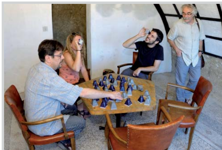
Suchan Kinoshita, Sans titre , 1999. Collection mac LYON