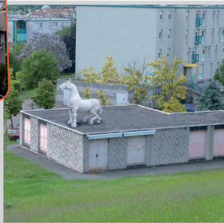
Jean-François Gavoty, Cheval XIII , 1990. Collection mac LYON Cheval XIII sur la Maison Romain Rolland (simulation)

du 12 octobre au 15 décembre 2013 à la Maison Romain Rolland Rolland et à la Mostra