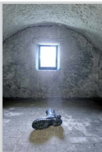
Eduardo Paolozzi, Tim's Boot , 1971. Collection mac LYON © Trustees of the Paolozzi Foundation Licensed by Adagp, Paris 2013