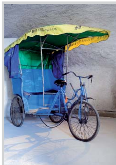
Shen Yuan, Pousse-pousse 18km/heure , vers 2004. Collection mac LYON © Adagp, Paris 2013