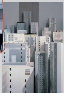
Kader Attia, Fridges , 2006. Collection mac LYON © Adagp, Paris 2013

du 17 octobre au 15 décembre 2013 à l'Artothèque