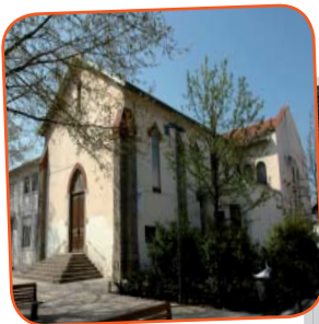
Bacatraille, Oullins.