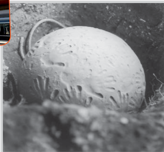
Claudio Parmiggiani, Terra , 1989. Collection mac LYON

du 10 octobre au 15 décembre 2013 à la MJC