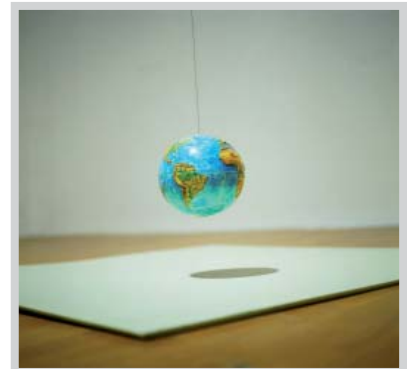
Luciano Fabro Mappamondo Geodetico , 1968. Collection mac LYON