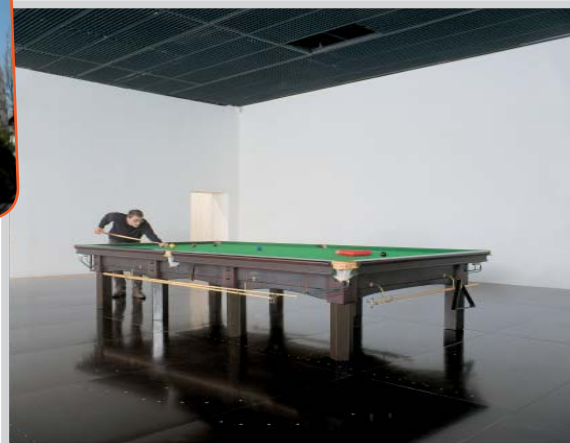
Michel Aubry, Salon de musique et salle de billard , 1991. Collection mac LYON