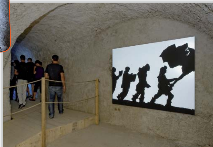
William Kentridge, Shadow Procession , 1999. Collection FNAC, dépôt au mac LYON

La traversée des souterrains à Grigny commence avec le Pousse-pousse de Shen Yuan et s'achève 10 œuvres plus loin avec la vidéo désaccordée de Tracey Rose.