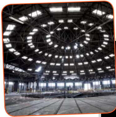
La Rotonde, Grigny.