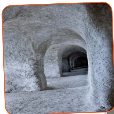
Les Souterrains, Grigny.