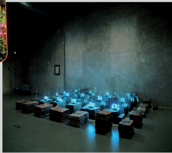
Mario Merz, Prolifération de notizie e di parole, 1970-1976. Transfert de propriété de l'Etat. Collection mac LYON

du 10 octobre 2013 au 15 janvier 2014 aux Musées Gadagne