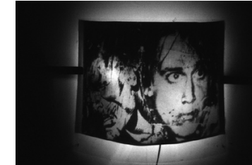
Sans titre, Non daté (80') Dessin, 20,5 x 32,5 cm Courtesy Alan Vega

Exposé au Project of Living Artists, NYC Lumière, plexiglas, bois, 112 x 167,5 cm Crédit photo Alan Vega Courtesy Alan Vega