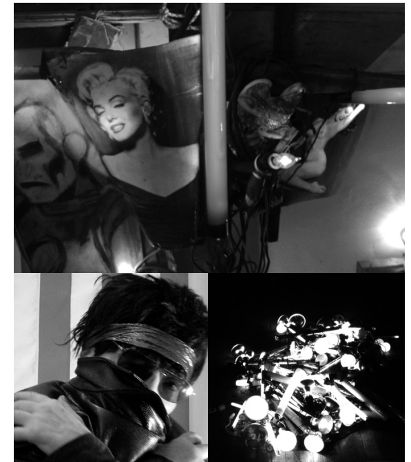
Untitled , 1969 Crédit: Anne E. Hubbard Courtesy Alan Vega