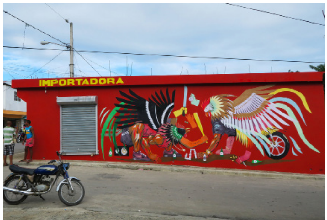
Franco Fasoli / Jaz , République Dominicaine, 2014 Collage sur mur