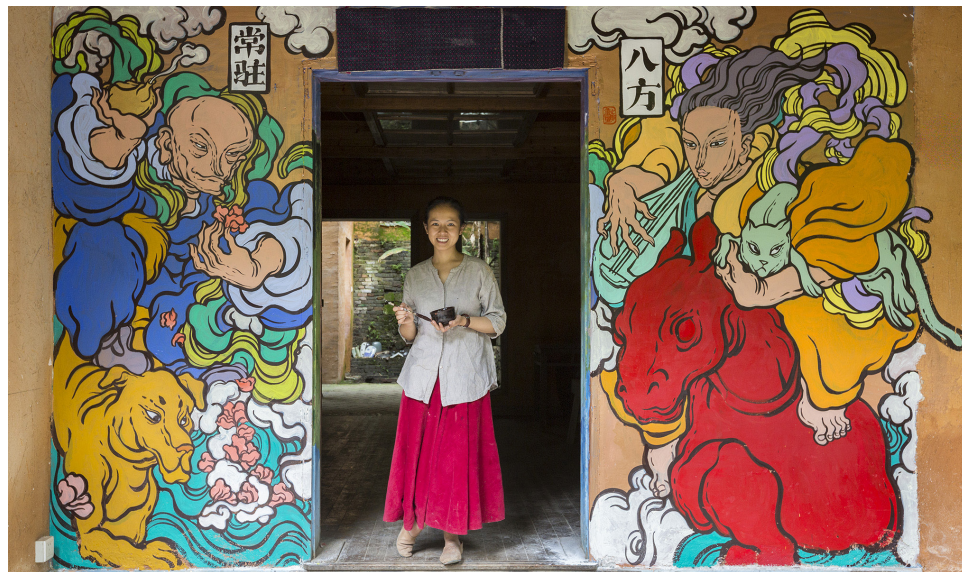
Wenna, "BaFang and ChangZhu" à JingDeZhen (Chine), 2015