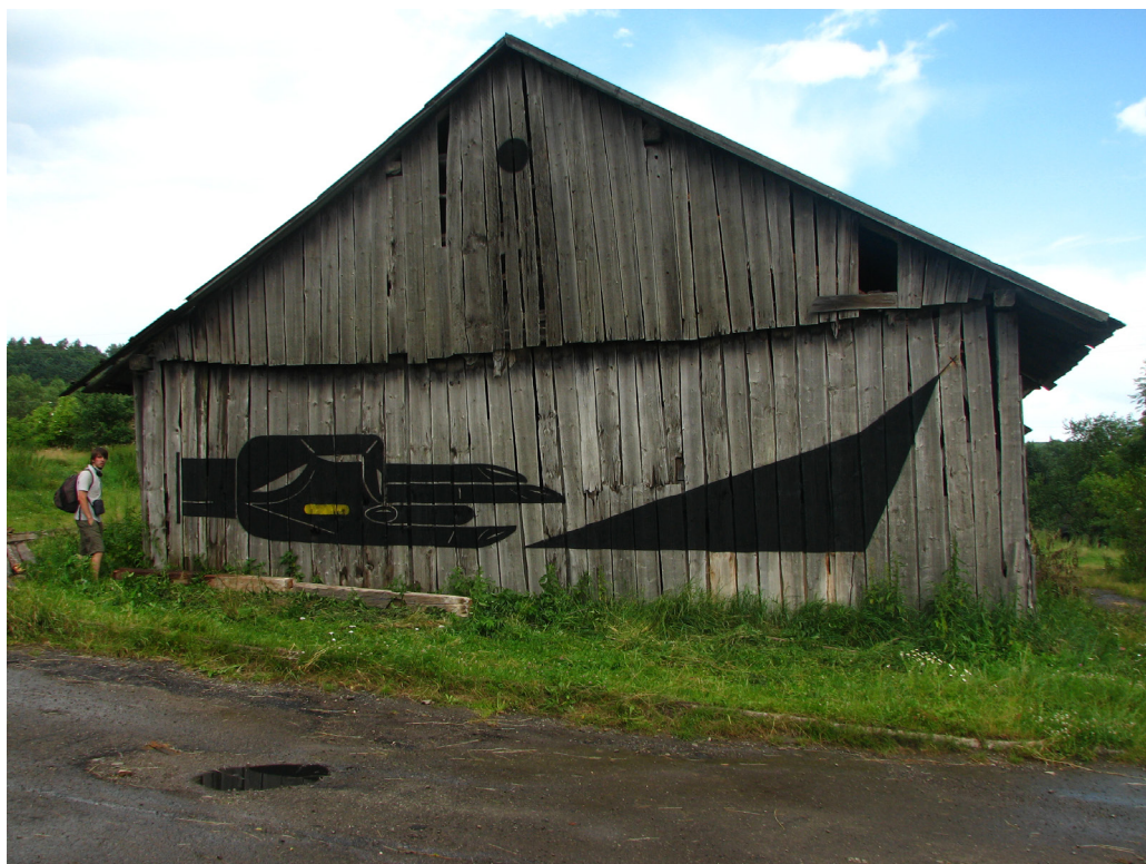
Teck (Sergii Radkevych) et 7906 - 5d relic.(FortMissia festival), Popovychi (Ukraine), 2010