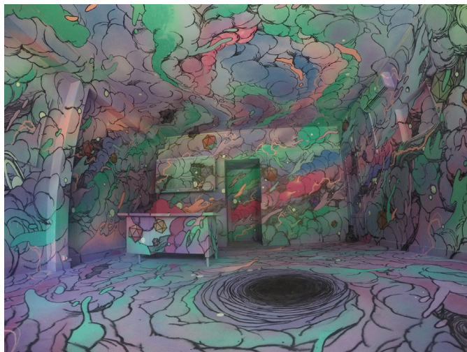
Kid Kréol & Boogie Peinture murale, mai 2015, Ile de la Réunion © photo : Kid Kréol & Boogie