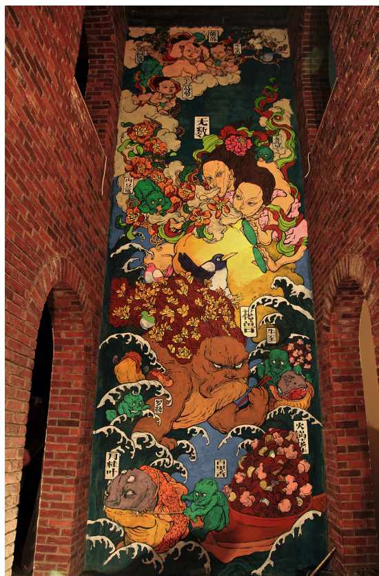
Wenna, "WuShu", Pékin (Chine), 2013