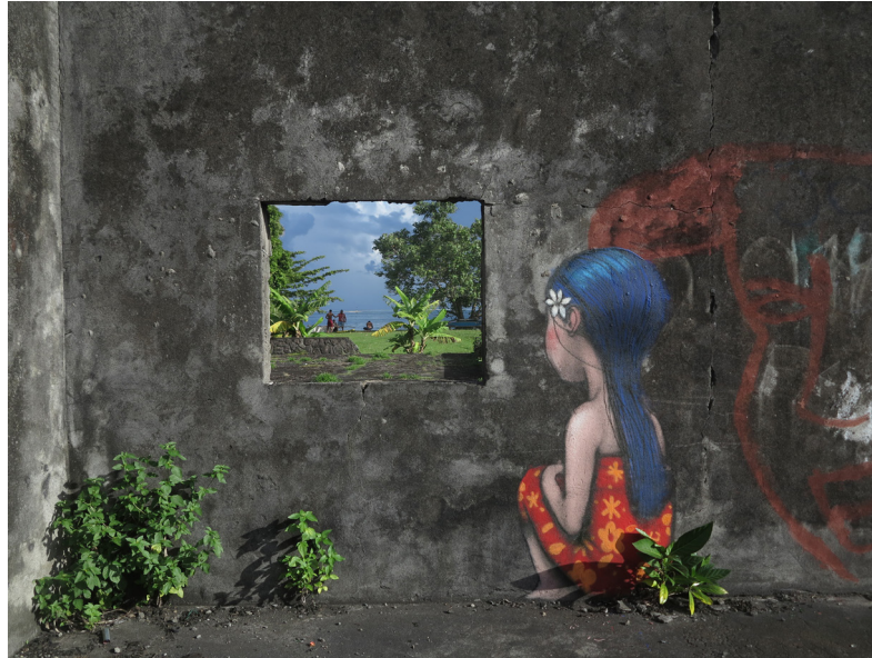
Seth, Tahiti (Polynésie Française), mai 2015