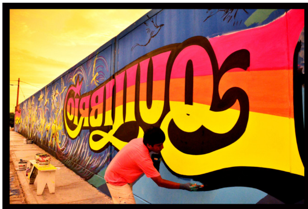
Elliot Tupac, Equilibrio , Trujillo - Pérou