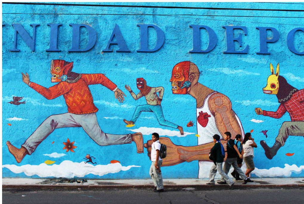
Saner, (Mexique)