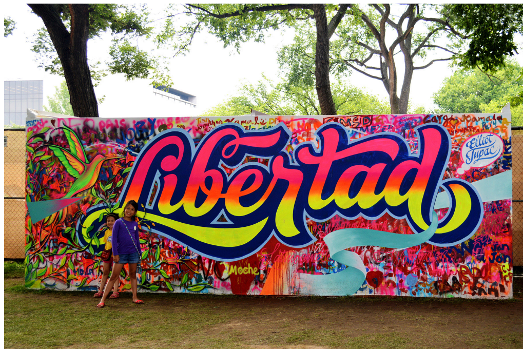
Elliot Tupac, Libertad , Washington DC (USA), 2015