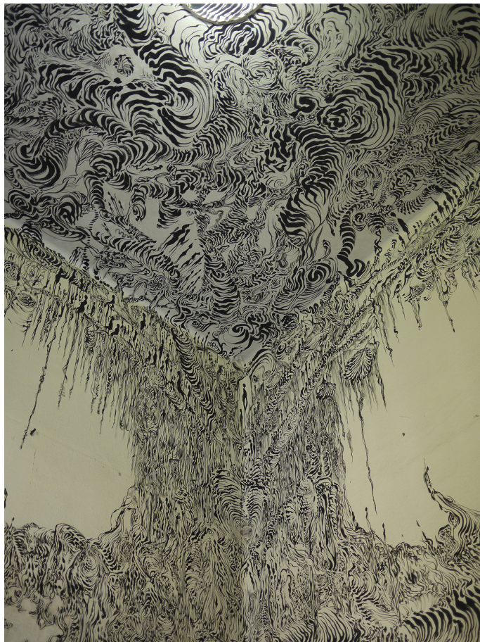
Charley Case, Seringueira , 2015 Encre de chine sur mur Expo feito por brasileiros , Cidade Matarazzo, Sao Paulo, Brazil

L'imagination de Charley Case trouve son origine dans la maîtrise du trait. Le fusain, l'encre de Chine, ou encore l'aquarelle constituent la matière de ses œuvres dont les formes combinent cercles et spirales, autant de symboles de l'irréversible cheminement de la vie vers la mort.