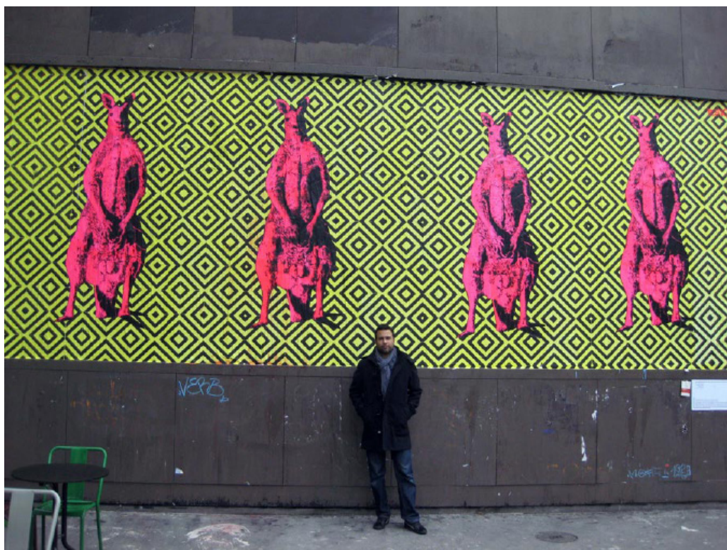
Reko Rennie