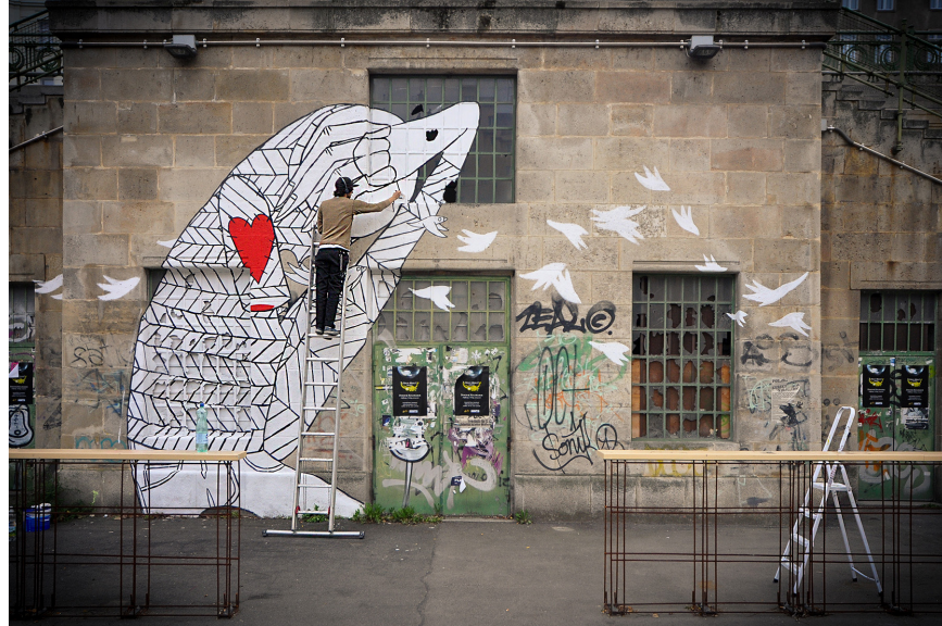
Addam Yekutieli aka Know Hope, installation, Vienne (Autriche), 2010