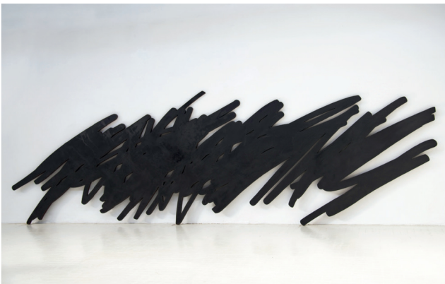
Bernar Venet, GRIB 4 , 2014

Bernar Venet utilise pour ses sculptures un type d' acier corten qui reçoit un traitement au chrome, au nickel et au cuivre afin que sa rouille soit d'une couleur intense.