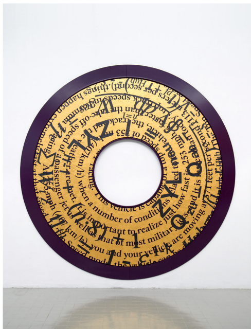
Bernar Venet, Bugatti Painting , 2012

Sa première sculpture, Tas de charbon (1963) est une œuvre qui joue avec la gravité et l'aléatoire. « Montrer un tas de charbon, pour moi, c'était montrer une sculpture qui pour la première fois dans l'histoire de l'art, n'avait pas de forme spécifique. (...) Le charbon, posé librement en tas, libérait la sculpture a priori de la composition imposée par l'artiste. »