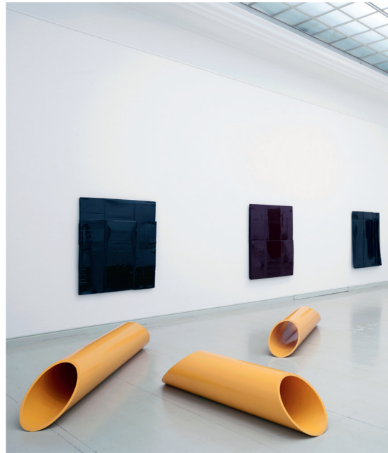
Bernar Venet Exposition: Kunsthalle Mücsarnok, Budapest, Hongrie, 2012

Entre 1971 et 1976, considérant être allé au bout de ses recherches formelles, Bernar Venet marque une pause dans sa production pour se consacrer à des investigations théoriques sur son œuvre et l'art en général. Il enseigne en France et à l'étranger. En 1971, il emprunte au sémiologue Jacques Bertin le terme de « monosémie » pour qualifier rétrospectivement les œuvres créées entre 1966 et 1970 : monosémiques , ses œuvres possèdent un seul niveau de signification, au même titre qu'un symbole mathématique ou un diagramme.