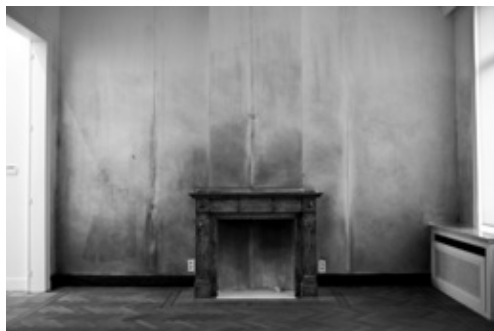
Hannelore Van Dijck, It is midnight, rain is beating against the window. It was not midnight. It was not raining , 2016.