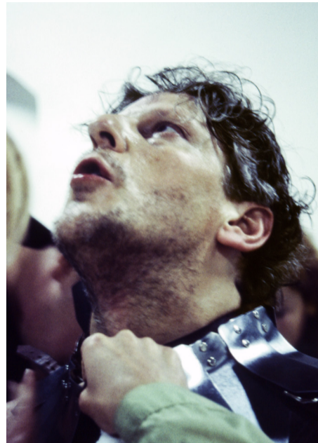
Jan Fabre, Sanguis/Mantis , 2001