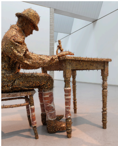
Jan Fabre, Me, Dreaming , 1978 Vue de l'exposition Jan Fabre. Hortus / Corpus (10 avril - 4 septembre 2011) Collection Museum van Hedendaagse Kunst Antwerpen, M HKA, Antwerp (Belgique) Photographe: Attilio Maranzano Courtesy Angelos bvba © Adagp, Paris 2016

* Extrait de l'entretien entre Jan Fabre et Germano Celant, 2013