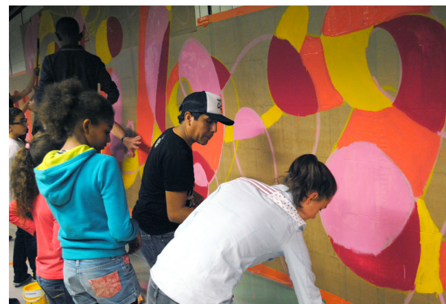
Fresque collaborative avec Elliot Tupac, Métro Part-Dieu, Wall Drawings Icônes urbaines, 2016