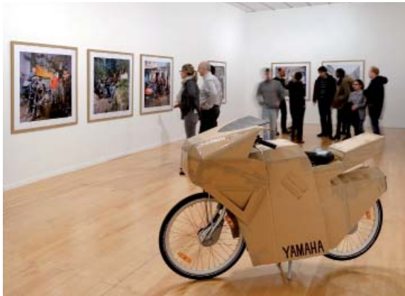
Vue de l'exposition Motopoétique au Musée d'art contemporain de Lyon, 2014. Benedetto Bufalino, La Moto Vélo'v , 2012

Benedetto Bufalino, né en 1982 à Décines-Charpieu (France), vit et travaille à Lyon. Il associe design, art et architecture pour transformer des objets ou des lieux de notre quotidien. Ses œuvres puisent dans l'ordinaire qu'il détourne avec poésie et dérision. Ses installations éphémères investissent rues, parcs, plages, jardins ou encore parkings : en 2007, pour la Fête des Lumières de Lyon, il remplit d'eau une cabine téléphonique pour en faire un aquarium ; en 2009, il crée une guirlande lumineuse avec neuf voitures ; en 2010, il installe une station Vélo'v en carton et en 2011, il transforme un skateboard en tapis volant. Pour l'édition 2016 de la Fête des Lumières, il métamorphose une bétonnière en boule à facette géante.