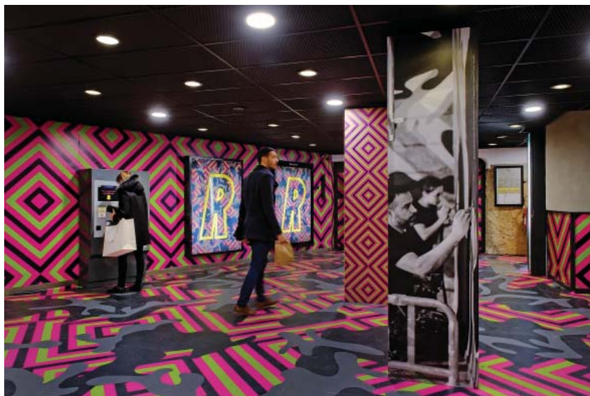
Reko Rennie, Parc République, 2016

Musée d'art contemporain Cité internationale 81 quai Charles de Gaulle 69006 LYON T +33 (0)4 72 69 17 17 info@mac-lyon.com www.mac-lyon.com