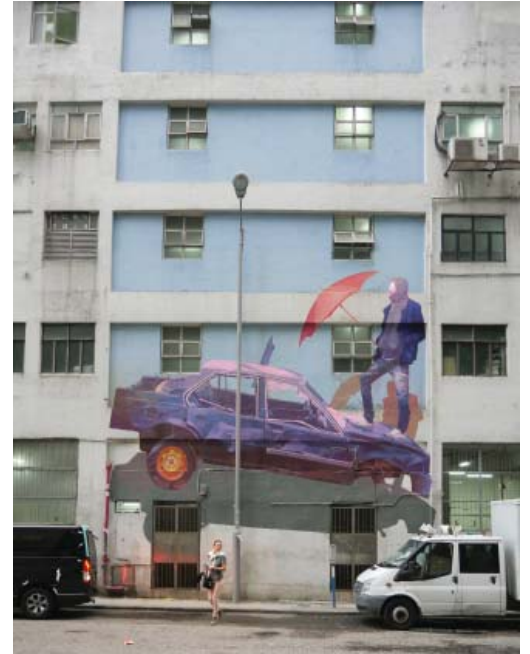
« Umbrellas », Acrylic on concrete, Zoerism Hong Kong 2017

Frédéric Battle, né en 1985 et connu sous le nom de Zoer, vit et travaille à Paris. C'est en 2003 qu'il commence à explorer le graffiti, ainsi que la peinture dans son ensemble, à travers l'acrylique puis l'huile. La passion qu'il développe enfant pour l'univers de l'automobile se ressent encore aujourd'hui dans son travail : les voitures abandonnées sont l'un de ses supports de prédilection, et les fresques qu'il réalise mettent très souvent en scène des véhicules. Zoer s'intéresse tout particulièrement aux lieux abandonnés et à leur devenir : immeubles désaffectés, épaves de bateaux ou encore décharges automobiles sont très présents dans ses œuvres.