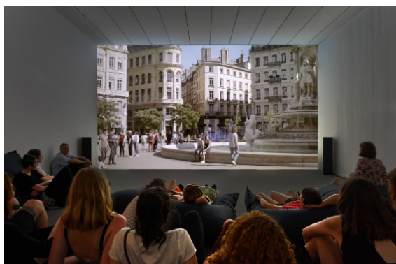
Lola González, Les courants vagabonds 2017. Vues de l'exposition au macLYON vidéo - Courtesy de l'artiste, Paris Collection macLYON Photos : Blaise Adilon