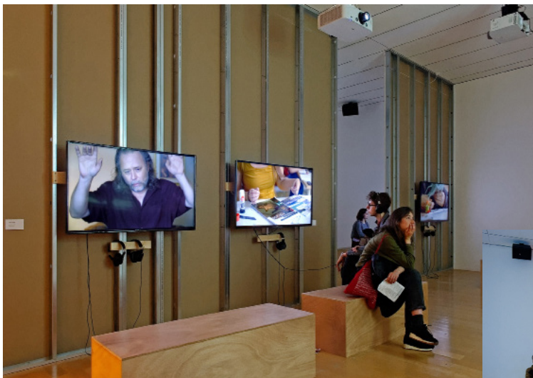
Vues de l'exposition Olivier Zabat, Le bruit , macLYON, 2017