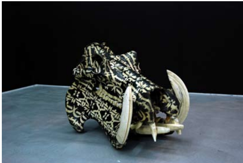
Kendell Geers Typhonic Beast 1, 2007 Crâne d'hippopotame marqué à la bombe noire avec le motif FUCK 77 x 55 x 45 cm