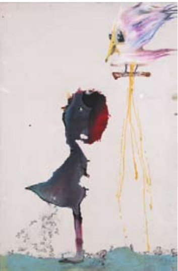
Rendez-vous 2007 Marlène Mocquet L'oiseau qui fait pipi, 2007 (Technique mixte sur toile)