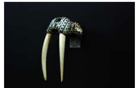
Kendell Geers Typhonic Beast 2, 2007 Crâne de morse marqué à la bombe noire avec le motif FUCK 60 x 40 x 30 cm