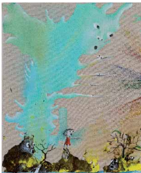
Marlène Mocquet, L'arbre effeuillé à la pomme , 2008 Techniques mixtes sur toile 26,5 x 22 cm Collection particulière

Depuis 2007, plusieurs expositions personnelles lui ont été consacrées : Galerie Alain Gutharc (Paris), Freight+Volume Gallery (New York), Galerie Edouard Manet (Genevilliers).