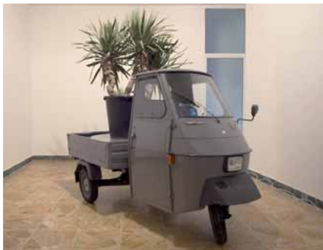
N'importe Quoi Bruno Peinado, My Own private piaggio , 2006 Courtesy Galleria Continua San Gimignano (Italie), Beijing (Chine), Le Moulin (France) © Adagp Paris, 2008

Ce sont quelques-uns de ces sujets qui sont présentés dans cette exposition, au travers d'oeuvres d'artistes éminent(e)s. Car, pour paraphraser un humoriste qui pensait qu'on pouvait rire de tout, mais pas avec n'importe qui, on peut certainement faire « N'importe quoi » dans un musée, mais pas avec n'importe qui.