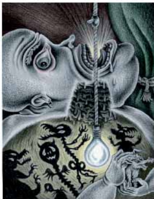
Stéphane Blanquet, Autoportrait , 2001 Crayon 15 x 21 cm Collection de l'artiste