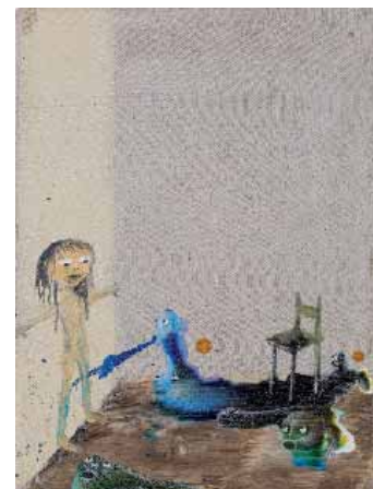
Marlène Mocquet, Attaquée par la peinture , 2007 Techniques mixtes sur toile 33 x 24 cm