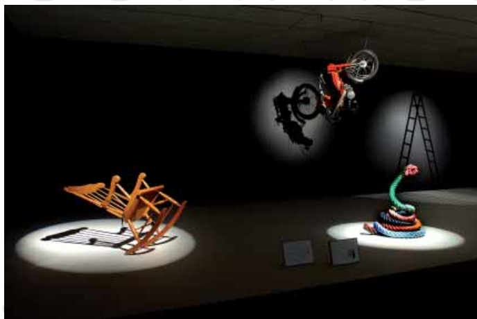
Vue de l'exposition « The Freak Show », 2007