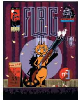
Gilbert Shelton, FLAG , 1991

Pour Quintet , Gilbert Shelton présente de nombreuses planches et illustrations représentatives de son univers graphique.