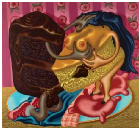
N'importe Quoi Peter Saul, Cake and Pie , 1996 167,5 x 183 cm collection MAC/VAL, Vitry-sur-Seine