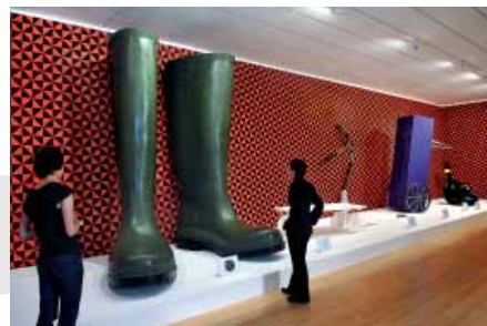
Lilian Bourgeat, Objet extraordinaire, Bottes de sept lieues , 2006