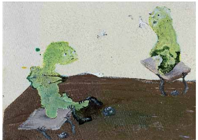
Marlène Mocquet, La peinture sable mouvante , 2008 Techniques mixtes sur toile 16 x 22 cm

Collection particulière