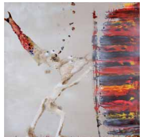
Marlène Mocquet, L'art martial rouge , 2008 Techniques mixtes sur toile, 200 x 200 cm Courtesy Galerie Alain Gutharc Copyright Marc Damage Collection particulière

Musée d'art contemporain Cité internationale 81 quai Charles de Gaulle 69463 LYON Cedex 06