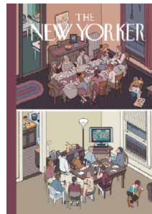
Chris Ware New Yorker; Thanksgiving — Conversation , 2006 Crayon bleu, encre et gouache blanche sur bristol 50,8 x 71,1 cm Collection de l'artiste

Pour Quintet , Chris Ware expose 50 dessins originaux représentatifs de ses séries cultes.