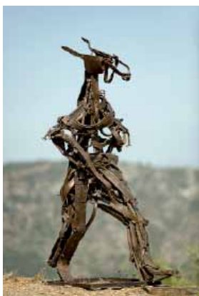
Francis Masse, Le galop du temps , « Le vieil étalon arrangeait ses cuirs avec délicatesse. Ce qui, selon lui, compensait sa molle pointe de vitesse. », 2000 Cuir, fer - 194 x 125 cm Collection de l'artiste