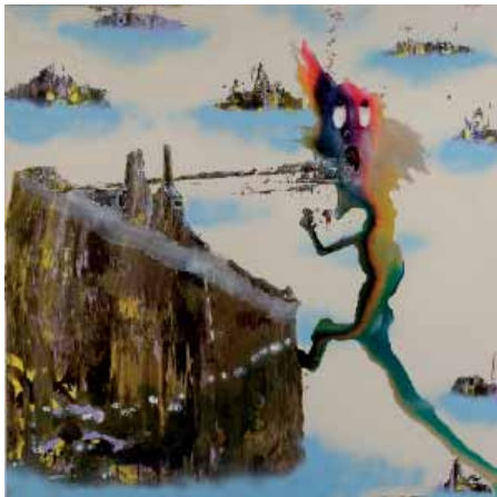
Marlène Mocquet, L'arc en ciel humain , 2008 Techniques mixtes sur toile 150 x 150 cm Courtesy Galerie Alain Gutharc - Copyright Marc Damage Collection particulière