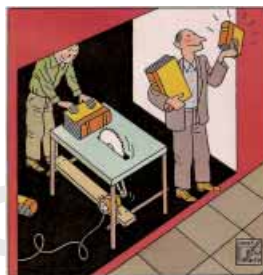
Joost Swarte, The New Yorker , 2007