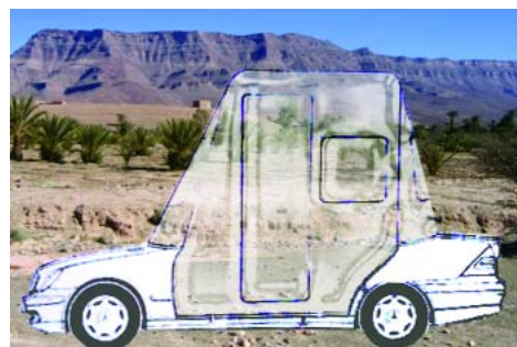
Slimane Raïs, dessin préparatoire à "Terre Promise" 2007 © Slimane Raïs

La seconde étape sera exposée les 13 et 14 octobre 2007 place des Terreaux dans le cadre de VEDUTA Biennale d'art contemporain de Lyon.