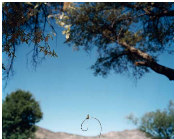
Jean-Luc Mylayne, n°419, avril-mai 2007 123 cm x 153 cm