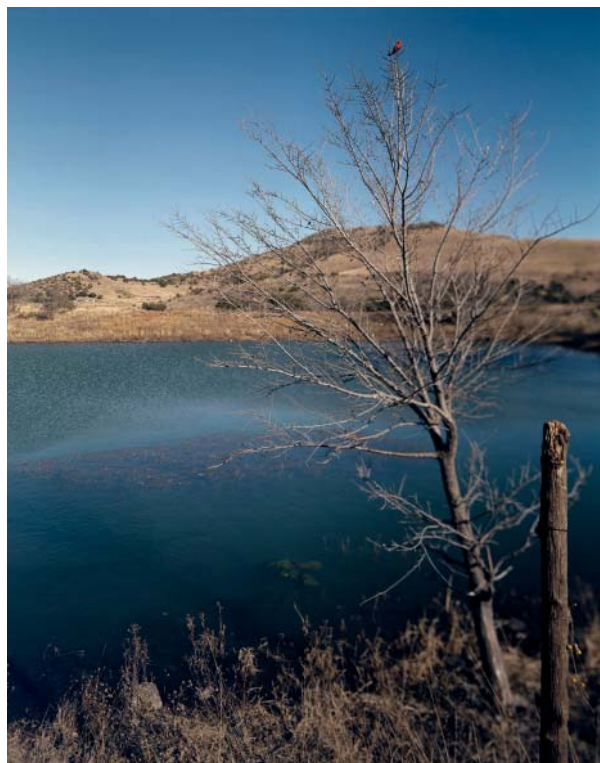
Jean-Luc Mylayne, n°348, novembre-décembre 2005 190cm x 153 cm

THIERRY RASPAIL (DIRECTEUR DU MAC LYON ), EXTRAIT DU CATALOGUE DE L'EXPOSITION.