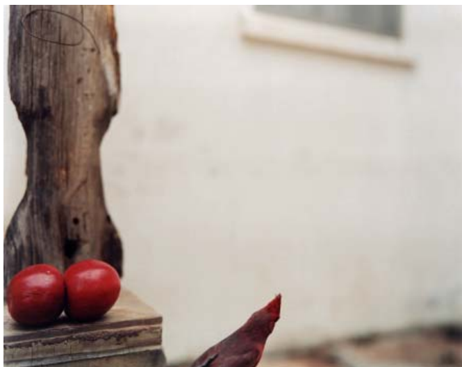
Jean-Luc Mylayne, PO-58 , février-mars 2007 123 cm x 153 cm

TERRIE SULTAN*, EXTRAITS DU CATALOGUE DE L'EXPOSITION.