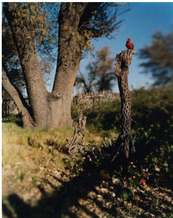
Jean-Luc Mylayne, PO-51 , mars-avril 2007 153 cm x 123 cm Crédit photo : Jean-Luc Mylayne

/ « LA PHOTOGRAPHIE ME PERMET DE VÉRIFIER SIMPLEMENT UN INSTANT - UNE MISE EN SCÈNE - QUI EXISTE VÉRITABLEMENT. QUAND JE VOIS UNE SCÈNE AVEC UN OISEAU DANS UN CONTEXTE HUMAIN, C'EST TRÈS POÉTIQUE, ET J'ESSAYE DE LA RECONSTITUER. IL Y A UNE MULTITUDE D'ÉVÈNEMENTS QUI ONT LIEU EN MÊME TEMPS ET QUE L'ON NE PEUT JAMAIS REFAIRE. [POURTANT], AUTANT QUE POSSIBLE, JE REFAIS CE QUE J'AI VU, ET LA PHOTOGRAPHIE EST LA PREUVE QUE CELA A EXISTÉ.» / JEAN-LUC MYLAYNE