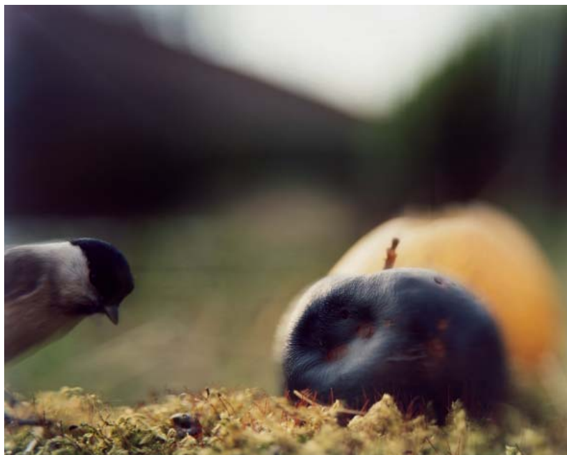
Jean-Luc Mylayne, PO-32, mars-avril 2001

Titre : Tête d'or Bilingue français/anglais Nombre de reproductions couleur : 80 Nombre de pages : 142 Format : 27 x 28 cm