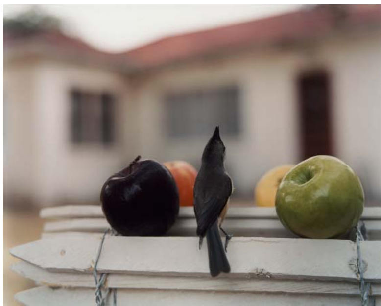
Jean-Luc Mylayne, PO-30, janvier-février 2006 123cm x 153 cm