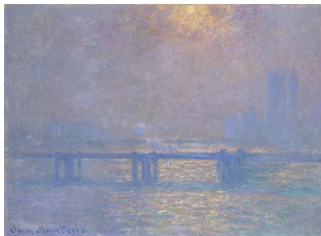
Claude Monet (1840-1926), Charing Cross Bridge, La Tamise, 1903 Huile sur toile 73,3 × 100,3 cm Lyon, musée des Beaux-Arts

Le tableau de Claude Monet dépeint un paysage habité par un élément qui fait partie intégrante de la capitale britannique : le pont ferroviaire de Charing Cross. Le sujet qui intéresse principalement le peintre est la variation de la lumière à différents instants de la journée, mais la présence de ce pont sur la Tamise s'impose dans la cité comme l'un des éléments architecturaux qui symbolisent Londres et sa modernité. Si la silhouette du Parlement en arrière-plan campe elle aussi le décor londonien, c'est bien la représentation de ce pont, comme élément principal, qui organise la composition du tableau : sa présence est plus palpable puisque le Parlement se dissout presque entièrement dans le fond.