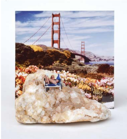
Gaëlle Foray, Zone de vacances , 2016 Assemblage, papier photographique et cristal de roche 10 x 10 x 10 cm Courtesy de l'artiste © Adagp, Paris, 2020

Gaëlle Foray pointe les désordres écologiques que génère notre attitude de consommateurs de voyages. Ses assemblages associant des pierres « cueillies » dans la nature avec des photographies anonymes fonctionnent comme des scènes de genre qui nous invitent à réfléchir sur nos habitudes contemporaines. L'artiste pratique donc elle aussi la mise à distance pour nous faire réfléchir à nos habitudes consuméristes. Les images abandonnées qu'elle récolte sont le reflet de notre époque. La photographie familiale de départ acquiert un aspect sociétal dans son association avec les autres.