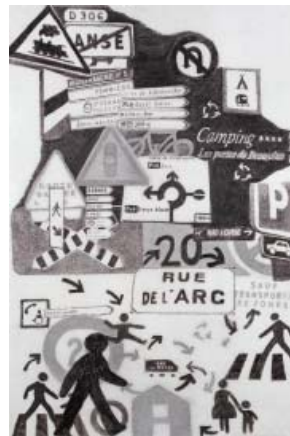
Christine Crozat, Série Et à partir de là , 2007 96 x 63 cm Crayon sur double papier Japon Tosha-washin Courtesy de l'artiste et de la Galerie Française Besson, Lyon

Fidèle à sa pratique de la collecte, Christine Crozat, à l'occasion de ses déplacements recueille dans le paysage routier une pluralité de signes, appartenant à un grand répertoire de formes schématisées : juxtaposés ou enchevêtrés, les éléments du code de la route, que nous percevons machinalement avec habitude sans jamais vraiment les regarder, forment un nouveau langage imaginaire qui recompose un trajet fictif. Les formes se situent dans un espace blanc indéfini.