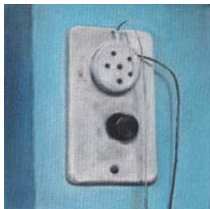
Fabienne Ballandras, Achmed , 2009 Série Cellules, Sentimentale Intellectuelle , 2009 Photographie couleur 120 x 150 cm