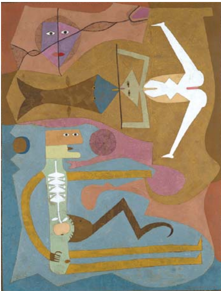
Victor Brauner (1903-1966), Les voies abandonnées , 1962 Huile sur toile 116,3 x 89 cm Lyon, musée des Beaux-Arts

Juif d'origine roumaine, Victor Brauner, exilé à Paris, s'insère dans le milieu surréaliste par son art qui puise dans la mythologie et l'ésotérisme et qui s'inspire de l'art précolombien et aborigène. Après son exclusion du groupe surréaliste, il tente de projeter son moi dans un monde animal hybride, inspiré de cosmogonies de peuples primitifs - maya, aborigène et esquimau -, auxquels il emprunte leurs systèmes de pensée prélogique. Son tableau énigmatique semble surgir des profondeurs du subconscient et décline son obsession pour le motif de l'œil tout autant qu'il déploie des éléments d'ordre mythologique : un serpent attaque le personnage assis pour atteindre la pomme dans son ventre, le poisson, symbole de fécondité et de sagesse, embrasse une créature-grenouille, lune et soleil se répondent de part et d'autre du personnage comme des symboles contraires, inspirés de la tradition alchimique, de la cabale ou encore de la mystique indienne. La représentation est d'apparence simple et dépouillée mais cache une technique complexe : le peintre confère une matérialité et