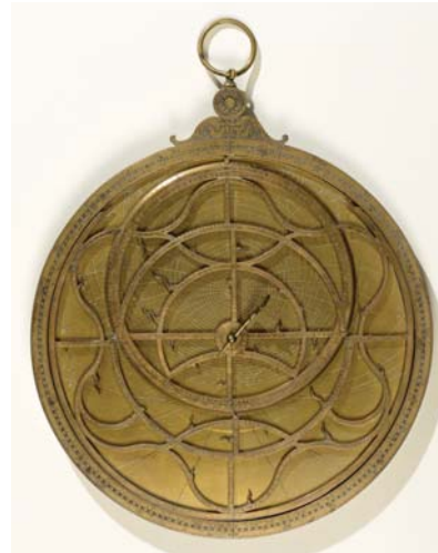
Jean Naze Astrolabe planisphérique, 1553 Laiton doré et gravé 20,7 x 27 x 2,1 cm Lyon, musée des Beaux-Arts

C'est pour une autre forme de cartographie que l'astrolabe planisphérique sert d'outil. La conception de l'espace est cette fois-ci scientifique et la compréhension de certains déplacements s'opère grâce à des outils de mesure. Dans le cas de cet astrolabe, il s'agit de mouvements célestes. Inventé par les Grecs, longtemps oublié puis transmis à l'Occident par les Arabes au Moyen Âge, cet objet sert à la fois à lire l'heure et à comprendre les mouvements célestes, notamment pour prévoir le lever et le coucher du soleil. Horloger lyonnais renommé au XVI e siècle, Jean Naze fait ici usage des mathématiques pour permettre la compréhension du déplacement des astres et de leur position à un instant T. Seules des personnes disposant de solides connaissances scientifiques peuvent s'en servir.