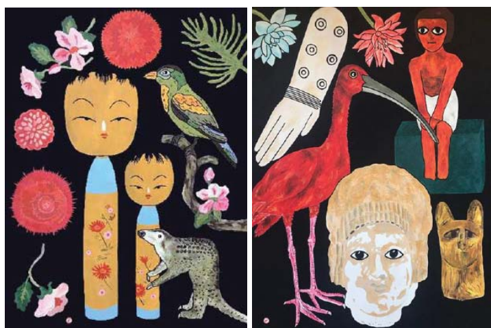
Géraldine Kosiak, Les dix mille choses , 2020 Série Les dix mille choses , 2020 Acrylique sur carton 80 x 60 cm

Géraldine Kosiak, Série Les dix mille choses , 2020