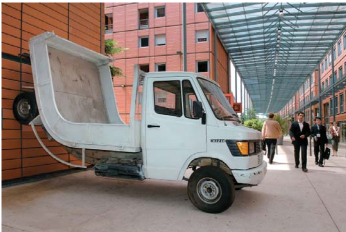
Erwin Wurm, Truck , 2007 Installation : camion incurvé 305 x 495 x 225 cm Environ 3 tonnes Collection du macLYON (Inv. : 2008.2.1)

Présente devant le musée depuis 2007, cette sculpture aurait pu être un ready-made mais Erwin Wurm a sculpté un camion Mercedes 307d de sorte à l'incurver pour le faire rejoindre le mur sur lequel il est accolé. Contrairement à la Super F-97 , l'artiste n'utilise pas un procédé administratif pour démettre de sa fonction le véhicule mais un moyen formel et matériel : le camion ne peut plus rouler puisqu'il perd l'équilibre s'il n'est pas contre un mur, avec deux de ses roues qui ne touchent plus le sol. Erwin Wurm joue ici avec la matérialité et nos sens, nous faisant croire à un matériau souple alors que le camion est bien rigide.