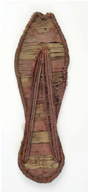
Sandale, Basse époque, Égypte Fibres végétales tressées naturelles et teintées de rouge 27,3 × 8,8 × 0,8 cm Lyon, musée des Beaux-Arts