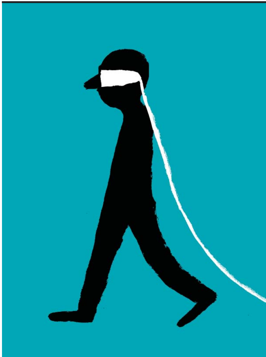
Illustration : Jean Jullien Courtesy de l'artiste et Galerie Slika, Lyon

Cette exposition sur l'expérience du déplacement, entre volonté et contrainte, est conçue à partir d'œuvres et d'objets d'art, de l'Antiquité à nos jours, choisis dans les collections du musée des Beaux-Arts et du Musée d'art contemporain de Lyon.