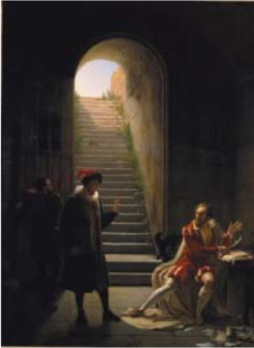
Fleury Richard (1777-1852), Montaigne visitant le Tasse en prison , 1821 Huile sur toile 130 x 100,5 cm Lyon, musée des Beaux-Arts

Fleury Richard, Montaigne visitant le Tasse en prison , 1821