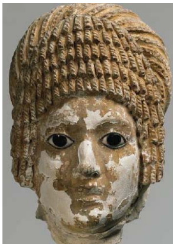
Égypte, Masque funéraire, Ier-IIe siècle ap. J.-C. Lyon, musée des Beaux-Arts

À côté de ses peintures, de gigantesques tapis en reprennent les compositions : réalisés avec le concours de la Manufacture de Tapis de Bourgogne, l'artiste établit un lien entre les objets représentés et l'artisanat.