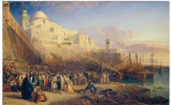
William Wyld (1806-1889), Départ d'Israélites pour la Terre sainte, 1841 Huile sur toile 110,3 x 176,2 cm Lyon, musée des Beaux-Arts

William Wyld, Le départ d'Israélites pour la Terre sainte, 1841