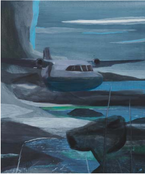
Marc Desgrandchamps, Sans titre , 2020 Huile sur toile 55 x 46 cm

C'est par un autre biais que Marc Desgranchamps nous entraîne sur ses voies intérieures. Jouant de coulées et de transparences, ses toiles sont peuplées de fantômes. L'artiste déploie une mémoire anonyme en plaçant de façon incohérente les éléments qui l'habitent. L'effet est mouvant, liquide, le monde semble sur le point de s'effacer ou de se désagréger.