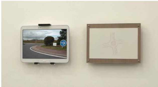
Lucie Chaumont, Giratoires , 2014 Vidéo couleur et son, mine graphite sur papier Durée : 9'04"

Inquiète de l'avancée de la globalisation qui ne laisse presque aucune marge de manœuvre, Lucie Chaumont prend un élément routier comme un archétype de la mainmise de l'homme sur la nature : le rond-point.