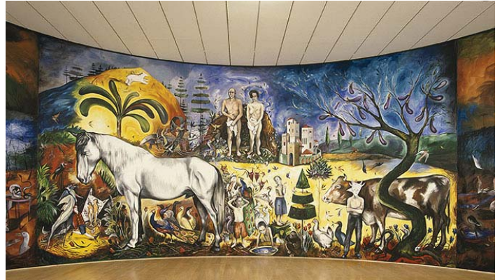
Carmelo Zagari, Enfer et paradis , 1998 Huile sur toile - 500 x 4100 cm Collection du macLYON

Carmelo Zagari, détails de Enfer et Paradis , 1998