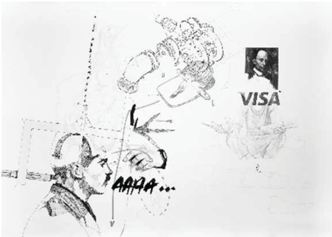
Nidhal Chamekh Le battement des ailes , 2017. Encre, graphite et transfert sur papier 100 x 140 cm