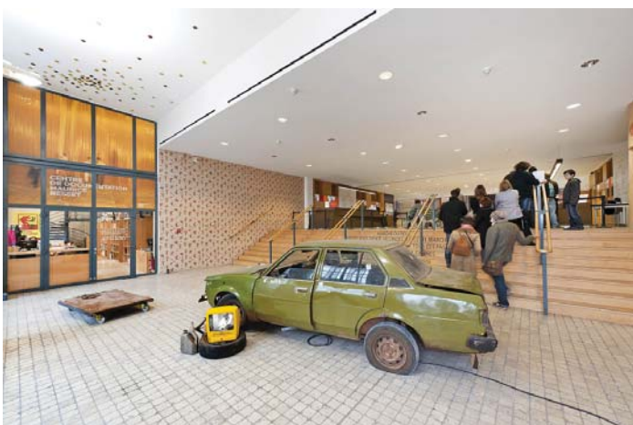
Pascale Marthine Tayou, La veille neuve, (La vieille neuve) , 2000 Installation avec un véhicule et film vidéo Durée : 10'00" / 40 m 2 Collection du macLYON (Inv. : 2001.5.1)

Pascale Marthine Tayou, de son vrai nom Jean Apollinaire Tayou, s'inspire de ses nombreux voyages en collectant à la fois des objets de rebut issus de la société de consommation et des matériaux organiques. À travers ses