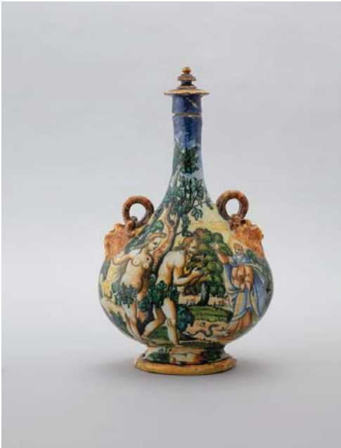
Gourde Adam et Ève, 2 nd e moitié du XVI e siècle Majolique stannifère à décor de grand feu 39,8 × 22,9 × 12,4 cm Lyon, musée des Beaux-Arts

Gourde Adam et Ève , 2 nd e moitié du XVI e siècle