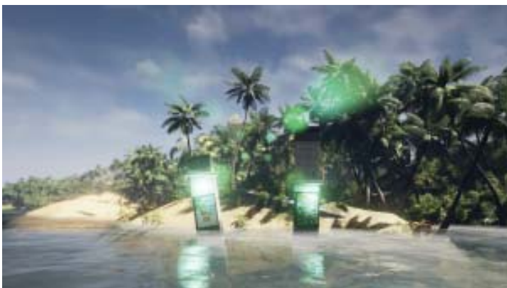
Jakob Kudsk Steensen, Primal Tourism , 2016 Vidéo couleur, son Durée : 22'41''