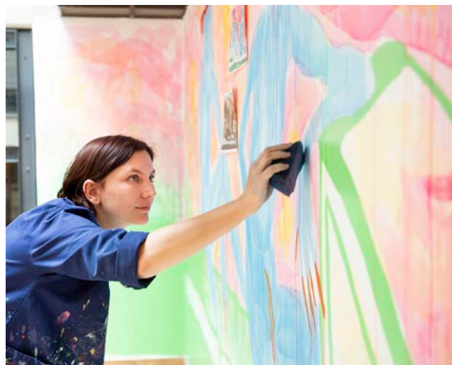
Hélène Hulak, photo Guillaume Perret

Grand Froid , 2023 Cintre métallique, tulle et molleton 50 x 100 cm Courtesy de l'artiste