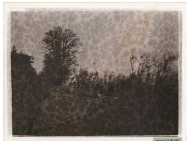
Abattages, 2021-2023 (série en cours) Tirage lith sur papier baryté chloro-bromure, virage sélénium, blanchiments hypochlorite de sodium 30 × 40 cm