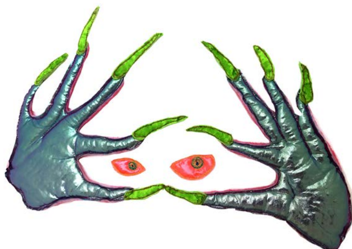
Beware of Margaret , 2021 Textile, molleton et broderie machine 80 x 60 cm Collection Céline Poizat