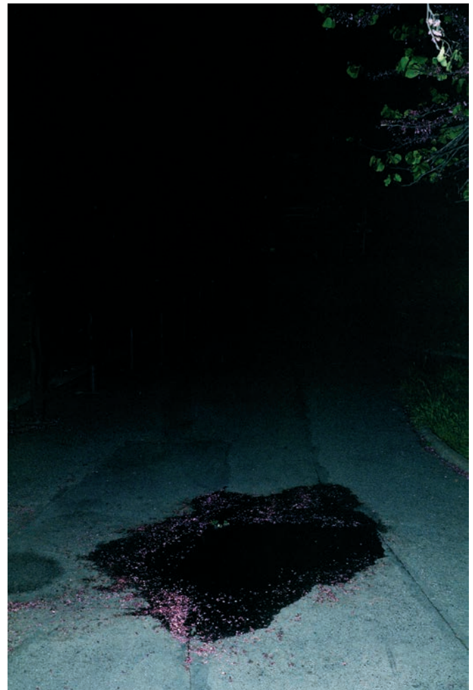
Sol 3, Noisy-le-Sec, 2021 Tirage jet d'encre sur papier baryté, dibond 120 × 80 cm