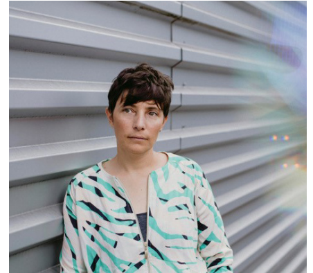
Aurélien Mole, Paris #1 , 2021.