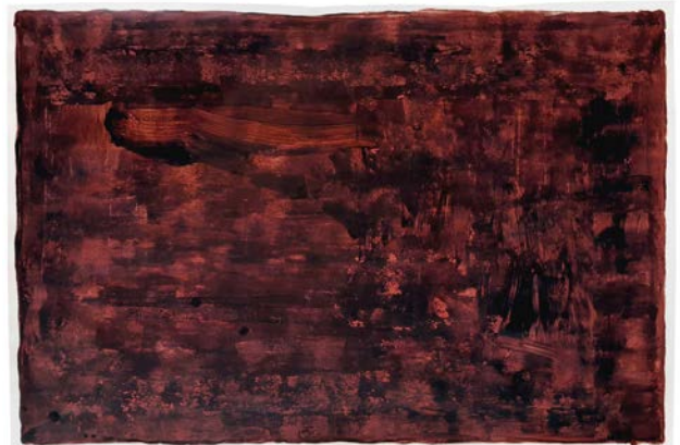
Mixtes, 2022 Boue d'acajoutine [terre de Cassel (Allemagne) + aniline], eau, bichromate, alcali, caséine 68 × 102 cm Courtesy de l'artiste