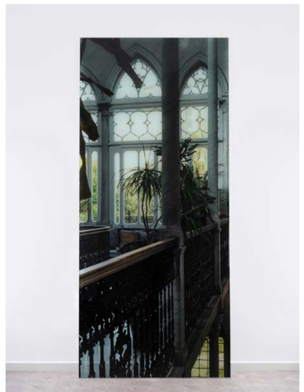
Aurélien Mole, 1958 [verre] , 2022.