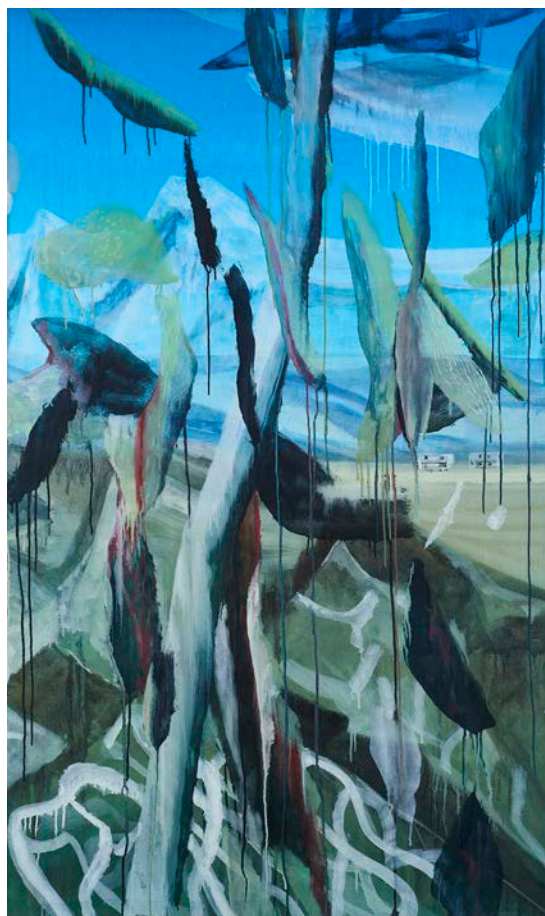
Untitled , 2008 Huile sur toile 162 × 97 cm