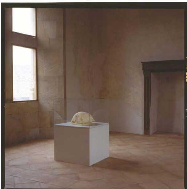
Dépouille , 1998

Œuvre Le Cadeau , 2000-2001, présentée dans l'exposition Incarnations, le corps dans la collection - Acte I au macLYON, 2023