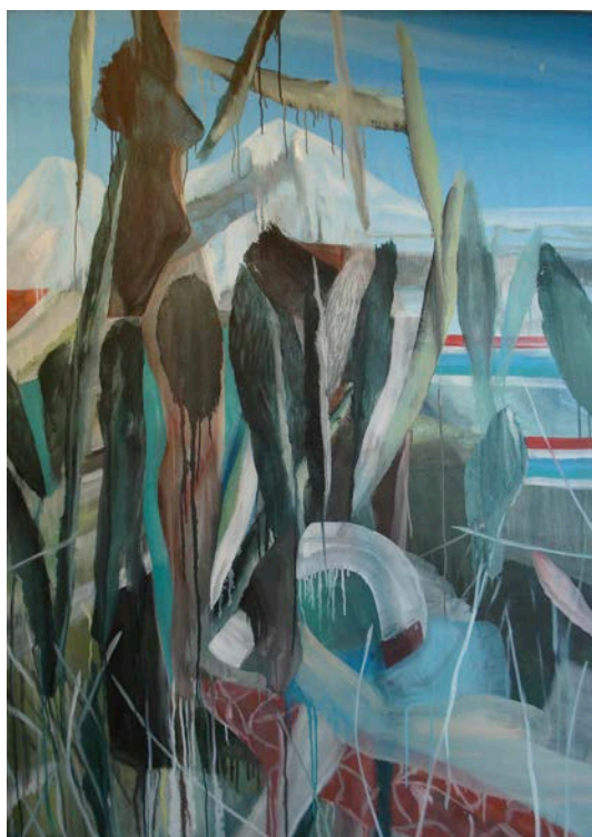
Untitled , 2009 Huile sur toile 162 × 114 cm Courtesy Galerie Lelong & Co © Adagp, Paris, 2023