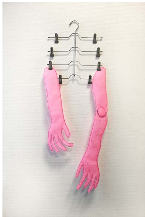
Grand Froid , 2023 Cintre métallique, tulle et molleton 50 x 100 cm