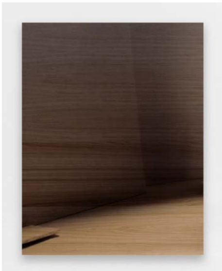
Aurélien Mole, Paris #1 , 2021. Photo Aurélien Mole Courtesy Ceysson & Bénétière

Courtesy de l'artiste et Ceysson & Bénétière