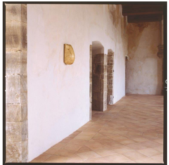
Hommage , 1998