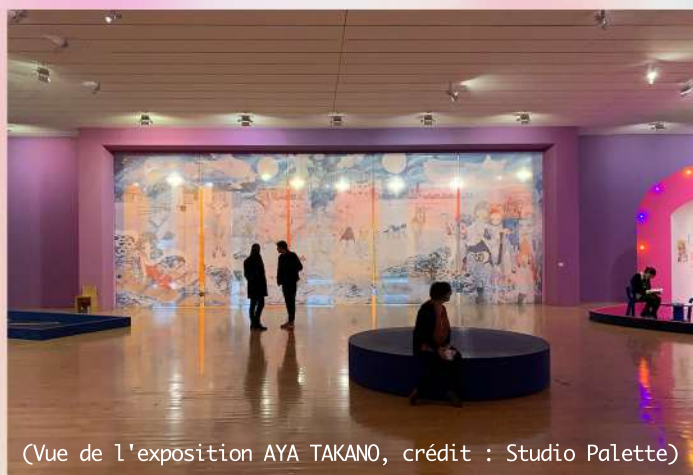
(Vue de l'exposition AYA TAKANO)