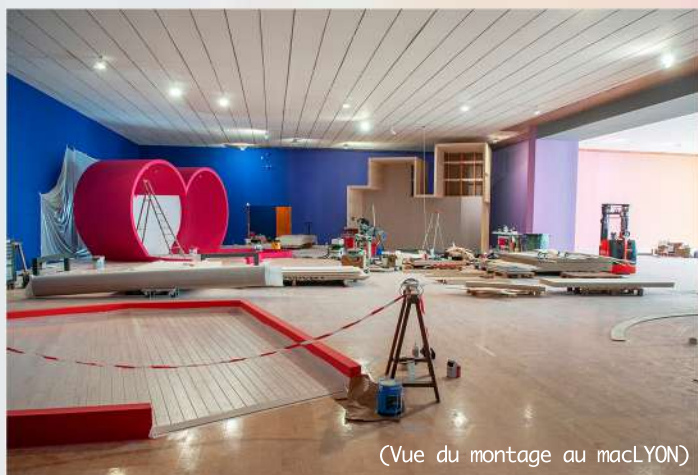
(Vue du montage au macLYON)