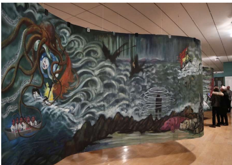
River of No Return [Rivière sans retour], 2012-2015, Peinture à l'huile sur 14 rouleaux de toiles, 2,20 m x 140 m Collection maLYON