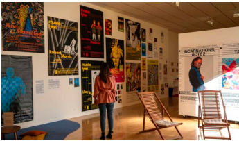
Accrochage sur l'histoire du graphisme du macLYON, novembre 2023