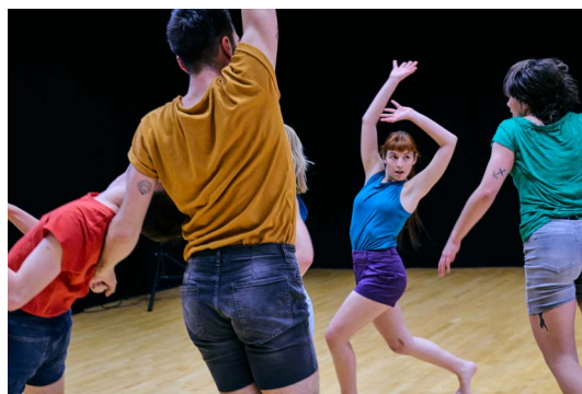
Spirit Desire , CCNR