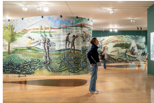
Vue de l'exposition Sylvie Selig, River of No Return au macLYON du 8 mars au 7 juillet 2024.

River of No Return - mesurant 140 mètres de long - se déploie sur l'ensemble du 1 er étage du musée. Autour de cette toile remarquable, de nombreuses œuvres dont sa Weird Family [son étrange famille].