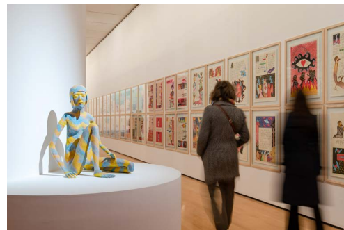
Vue de l'exposition Friends in Love and War – L'Éloge des meilleur-es ennemi-es au macLYON du 8 mars au 7 juillet 2024. Œuvres : Francis Upritchard, Marianne , 2016. British Council Collection + Fabien Verschaere, Seven Days Hotel , 2007. Collection macLYON © Adagp, Paris, 2024.

L'exposition s'intéresse au thème de l'amitié, autour d'une sélection d'œuvres des collections du British Council et du macLYON. Elle présente également les œuvres d'artistes spécialement invité-es, qui entretiennent des liens de longue date avec ces deux villes jumelées : Lyon et Birmingham. À découvrir au 3 e étage.