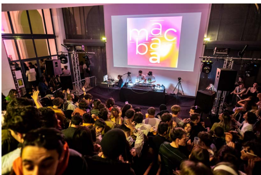
Nocturne étudiante 2023