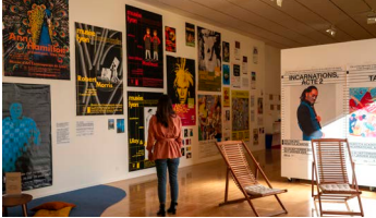
Accrochage sur l'histoire du graphisme du macLYON, novembre 2023