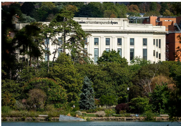
Vue du musée