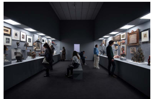
Vue de l'exposition Désordres - Extraits de la collection Antoine de Galbert au macLYON du 8 mars au 7 juillet 2024.

Pensée en étroite collaboration avec Antoine de Galbert, l'exposition rassemble plus de 200 œuvres, montrant ainsi la richesse et la singularité de cette collection au fil d'un parcours divisé en une dizaine de salles sur l'ensemble du 2 e étage du musée.