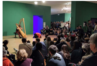
What'Sup, festival du CNSMD au maCLYON, 2023

+ pour ponctuer la journée : interventions sonores et musicales proposées par les étudiant-es du CNSMD Lyon (Conservatoire national supérieur de musique et de danse) de Lyon)