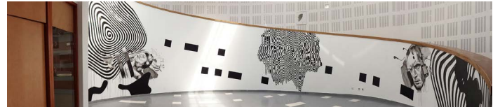
Transmission par Ludovic Paquelier, Le Toboggan, 2013

Wall drawing par l'artiste Ludovic Paquelier, inspiré de moments forts de l'histoire du musée Dans le hall d'entrée