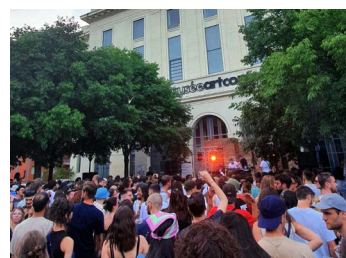
Soirée Tapage Nocturne, Nuit des musées 2022