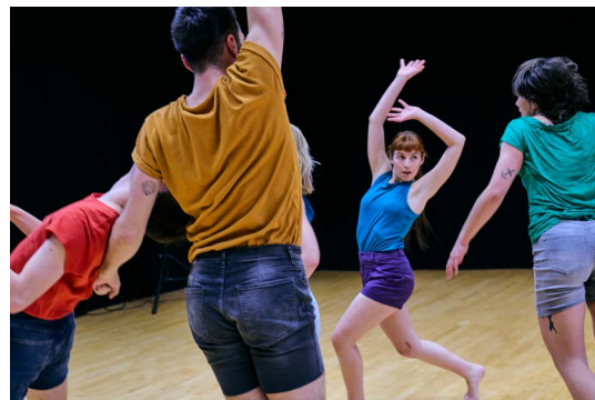
Spirit Desire , CCNR © Photo : Sébastien Erôme