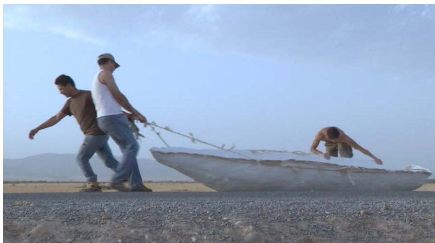
Marcos Ávila Forero, Cayuco [extrait], 2012 Vidéo, couleur, son — Durée : 54'39"