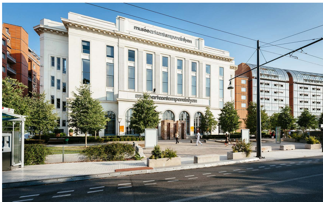
Vue du Musée d'art contemporain de Lyon

Réunies en 2018 sous la forme d'un pôle des musées d'art, les deux collections du musée des Beaux-Arts et du Musée d'art contemporain de Lyon forment un ensemble exceptionnel sur les scènes française et internationale.