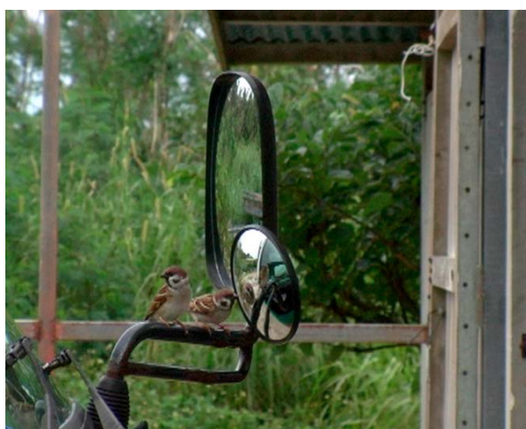
Cédric Eymenier, Reflexion Bird [extrait], 2007 Vidéo, couleur, son — Durée : 5'50" (en boucle) Musique : Joe Gilmore — © Adagp, Paris, 2026