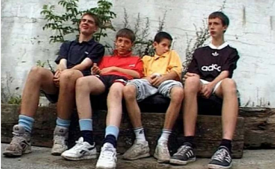
Gillian Wearing, Boytime [extrait], 1996