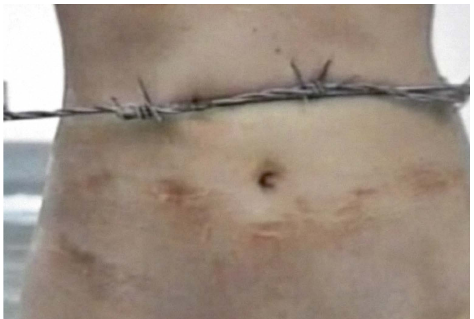
Sigalit Landau, Barbed Hula [extrait], 2000 Vidéo, couleur, son — Durée : 1'52" (en boucle)

Consacré aux gestes de résilience, le dernier chapitre du parcours d'exposition plonge les visiteur-euses dans une atmosphère positive. Selon moi, la résilience est un état « d'adaptation positive » après avoir dépassé la douleur. Un état qui offre une nouvelle forme de pouvoir collectif, d'espoir, de joie. Grâce à la diversité de ses outils narratifs, l'art vidéo offre une formidable puissance imaginative pour raconter des récits de résilience, de résistance, de communauté et d'autonomisation. C'est le cas avec Les Indes Galantes de Clément Cogitore, où les danseuseuses marquent un moment de force collective par une danse Krump énergique, en réponse aux multiples formes de répression exercées sur les minorités et subies par celles-ci. Ou encore dans les œuvres de The Myth of Progress de Klara Lidén et The Working Life de SUPERFLEX, qui offrent une vision humoristique et résistante des contraintes de la méritocratie occidentale, soit en inversant la marche avant en une marche arrière larmoyante, soit en quittant simplement le monde du travail pour se réfugier dans une réalité tout autre grâce à la méditation.